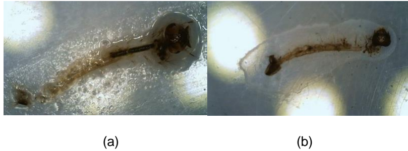
Gambar 3. Kerusakan morfologi larva instar III Aedes aegypti pada konsentrasi (a) 500 ppm dan (b) 1.000 ppm.