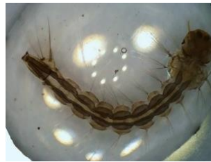
Gambar 4. Morfologi larva instar III pada kontrol negatif.

Larva instar III terlihat hanya memiliki abdomen dan sistem pencernaan saja dan bagian luar (kutikula) sudah terlepas dari tubuh larva serta warna yang transparan (Gambar 3a dan 3b). Kerusakan morfologi ini diduga karena senyawa yang terkandung pada ekstrak S. marcescens . Ekstrak S. marcescens strain MBC1 mengandung alkaloid prodigiosin dan saponin (Variani et al., 2021). Alkaloid sebagai racun perut yang mengurangi nafsu makan ( antifeedant ) dan masuk melalui membran sel kutikula larva (Cania & Setyaningrum, 2013). Saponin yang bekerja sebagai racun kontak yang dapat mencuci lapisan lilin yang melindungi tubuh larva dan merusak bagian luar (kutikula) (Arimaswati et al., 2017).