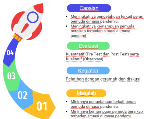
Gambar 1. Kerangka Pemecahan Masalah Dalam Kegiatan Pengabdian

Langkah dalam kegiatan pengabdian ini secara umum meliputi tahap persiapan, tahap pelaksanaan, dan tahap penyelesaian. Dalam tahap persiapan dilakukan kegiatan: (1) koordinasi dengan lembaga pemerintahan, masyarakat, serta organisasi kepemudaan di tempat kegiatan pengabdian dilaksanakan, (2) koordinasi dengan khalayak sasaran, (3) mempersiapkan materi, alat dan bahan yang digunakan, serta narasumber yang akan menyampaikan pelatihan. Alat dan bahan yang dipersiapkan antara lain modul pelatihan dan media yang diperlukan dalam pelaksanaan.