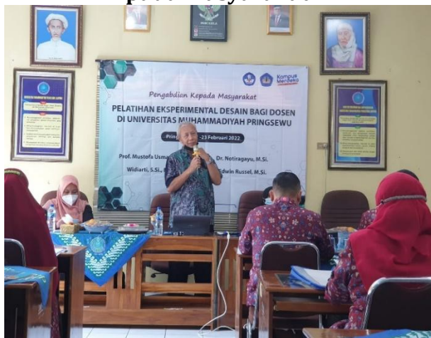
Gambar 3. Suasana kegiatan pengabdian pada masyarakat.

Didasarkan Cohen's guidelines, treatment effects (Warna) diklasifikasian mempunyai efek yang besar (>0.40) (Cohen, 1988; Usman dkk, 2008).