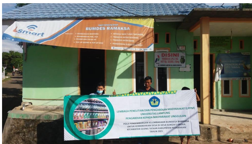
Gambar 1. Kunjungan ke Bumdes Ramaksa oleh Tim Pengabdian Universitas Lampung

Kegiatan Pengabdian kepada Masyarakat ini diawali dengan melakukan koordinasi dengan pemerintah Desa Sungai Langka (Gambar 1). Hal ini dimaksudkan untuk menyampaikan rencana kegiatan pengabdian, penetapan peserta kegiatan, dan meminta dukungan agar kegiatan ini berjalan dengan baik.