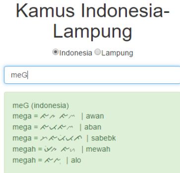
Gambar 4. Penterjemahan bahasa Indonesia dengan kombinasi huruf kecil dan besar