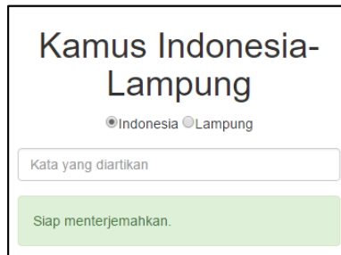
Gambar 2. Tampilan antarmuka pengguna smartphone kamus Aksara Lampung