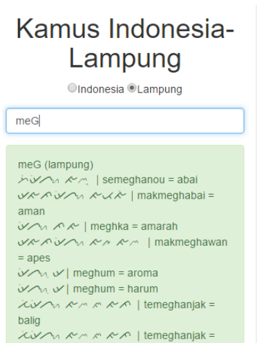
Gambar 5. Penterjemahan transliterasi Lampung dengan kombinasi huruf kecil dan besar