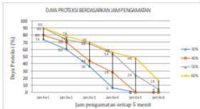
Gambar 3. Efek Pemakaian Lotion Ekstrak Daun Zodia ( Evodia suaveolens ) Terhadap responden pada skala laboratorium 1

menahan aromanya menjadi lebih harum. 16