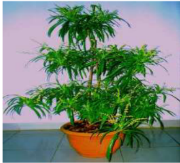
Gambar 1. Tanaman Daun Zodia 8