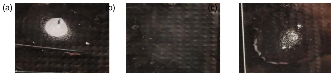
Gambar 3. Hasil pengamatan uji katalase : Isolat TBP B3 terbentuk gelembung udara yang menunjukkan uji positif (a), TB1 B2 tidak membentuk gelembung udara yang menunjukkan uji negatif (b), TMA2 B2 terbentuk gelembung udara yang menunjukkan uji positif (c).