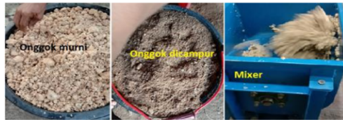
Gambar 8. Tahapan pembuatan campuran pakan