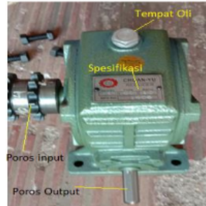
Gambar 6. Gear box atau penurun putaran

Gambar 6. Sedangkan untuk pencetak bahan baku menjadi pelet digunakan lempengan tembaga dengan beberapa lobang (Gambar 7)