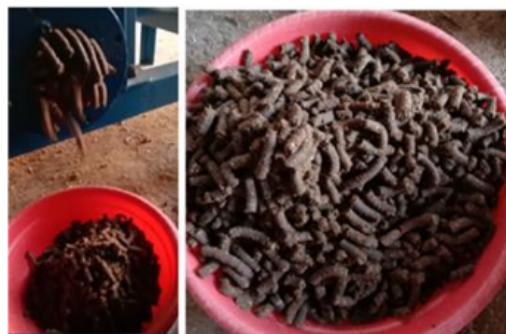
Gambar 10. Pelet hasil cetakan

Kapasitas produksi mesin cetak pelet pakan sapi dari bahan onggok singkong secara normal adalah sebesar 80 kg/jam. Jumlah itu merupakan pelet basah yang sudah tercetak, sementara itu, setelah pencetakan dipelukan lagi satu tahapan. Tahapan tersebut adalah tahapan pengeringan, karena bahan baku pelet masih dalam keadaan mengandung air. Untuk konsumsi sapi dan dicampur dengan bahan pakan ternak lainnya seperti pakan hijau, konsentrat dan molasis.