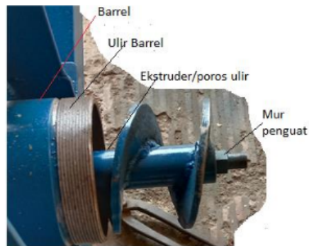
Gambar 4. Ekstruder yang mendorong adonan menuju cetakan sehingga berbentuk buliran

Mesin penggerak yang digunakan adalah mesin diesel dengan kapasitas daya sebesar 10 hp, sebagaimana yang ditunjukkan pada Gambar 5. Daya motor keluar dari poros mesin adalah sebesar 10 hp sehingga bisa dipindahkan ke poros yang digunakan untuk memutar ekstruder (Gambar 5)