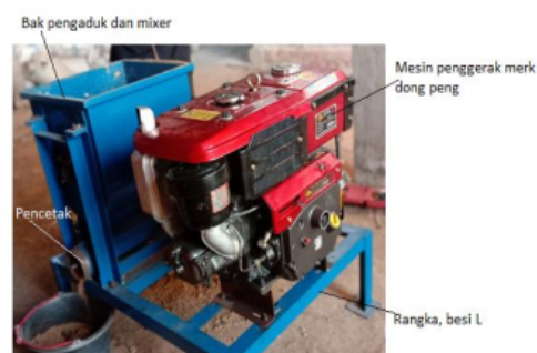
Gambar 1 Mesin pencetak pakan ternak pelet dengan sistem ekstruder

Proses pembuatan mesin pencetak pelet pakan ternak dilakukan dengan mendesain terlebih dahulu. Desain dilakukan menggunakan gambar dan asembeli. Kemudian dilakukan pembuatan dan perakitan sehingga didapatkan beberapa komponen mesin. Komponen-komponen dibuat secara terpisah, kemudian perakitan komponen yang sudah dibuat. Berikut ini adalah komponen-komponen mesin pencetak pelet pakan ternak sapi. Beberapa diantaranya dalam bak tempat dilakukan pencampuran dan pengadukan. Mesin diesel yang digunakan untuk menggerakkan ekstruder dan mikser, roda gigi sebagai alat transmisi, dan beberapa alat lain, yang masing-masing digunakan sesuai dengan fungsinya, sebagaimana yang ditunjukkan pada Gambar 1 dan Gambar 2.