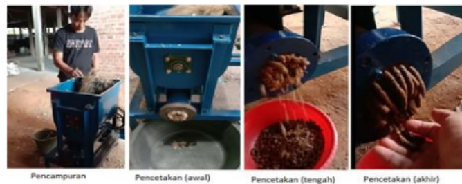
Gambar 9. Proses pencetakan pelet