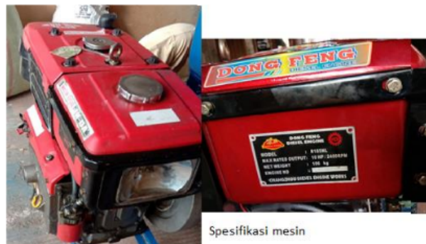
Gambar 5. Mesin diesel yang digunakan memiliki daya sebesar 10 hp

Mesin penggerak yang digunakan adalah mesin diesel dengan kapasitas daya sebesar 10 hp, sebagaimana yang ditunjukkan pada Gambar 5. Daya motor keluar dari poros mesin adalah sebesar 10 hp sehingga bisa dipindahkan ke poros yang digunakan untuk memutar ekstruder (Gambar 5)