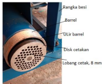
Gambar 7. Pencetak pelet berukuran diameter 8 mm