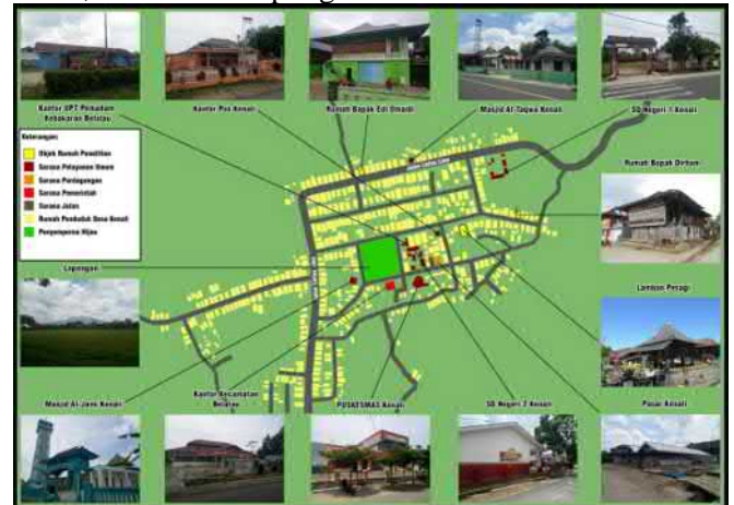
Gambar 1. Peta dan kondisi kawasan obyek studi Pekon Kenali Kabupaten Lampung Barat.

Secara khusus tim peneliti akan mengadakan pengumpulan data dan observasi pelestarian bangunan arsitektur. Mengaitkannya dengan data atau teori serta hasil wawancara. Menyimpulkan apa saja yang terkait dengan konsep pelestarian bangunan arsitektur mendukung tujuan pembangunan berkelanjutan guna perkembangan dimasa yang akan datang, serta menelusuri proses perkembangannya hingga terjadi saat ini sampai dengan menemukan jawaban mengapa hal ini terjadi. Lokasi penelitian berada di Pekon Kenali, Kecamatan Belalau, Kabupaten Lampung Barat, Provinsi Lampung.