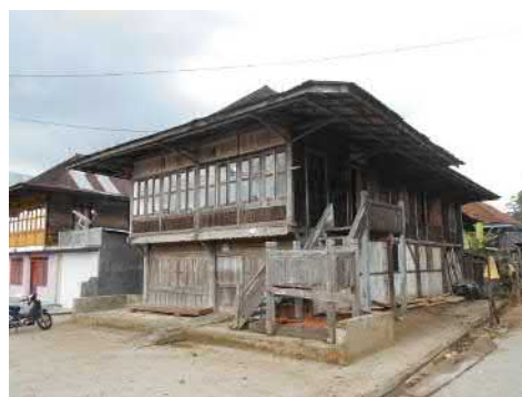
Gambar 3. Bangunan arsitektur panggung yang sudah bertransformasi menjadi dua lantai.

Sebagai bentuk kepedulian terhadap bangunan arsitektur rumah panggung ( tangible ), khususnya sesuai nilai-nilai yang ada dalam bangunan arsitektur secara tradisi maupun filosofi, sejak awal pembangunan mendirikan rumah panggung diadakan acara ritual sebagai bentuk penghormatan kepada Tuhan Yang Maha Esa dan para leluhur agar kelak kemudian hari kehidupan berjalan dengan baik.