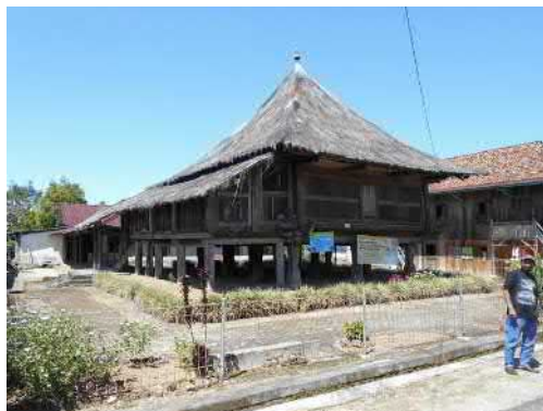
Gambar 2. Lamban Pesagi; salah satu bangunan benda cagar budaya yang telah ditetapkan oleh BPCB Banten.

nilainya. Benda cagar budaya merupakan benda warisan budaya dan sejarah yang patut dijaga dan dilestarikan keberadaannya.