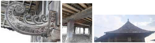
Gambar 4. Elemen arsitektur bangunan panggung.

dinding, lisplank, maupun atap sudah sangat jarang ditemui.