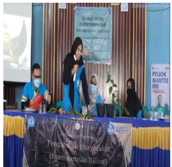
Gambar 4. Demonstrasi teknik perbanyakan