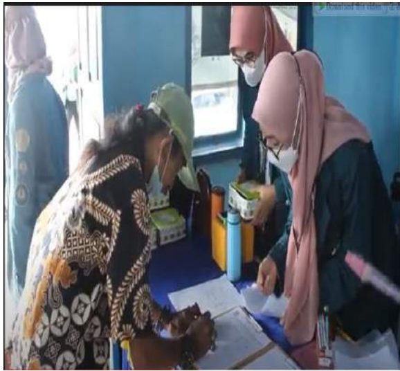
Gambar 1. Pendaftaran peserta