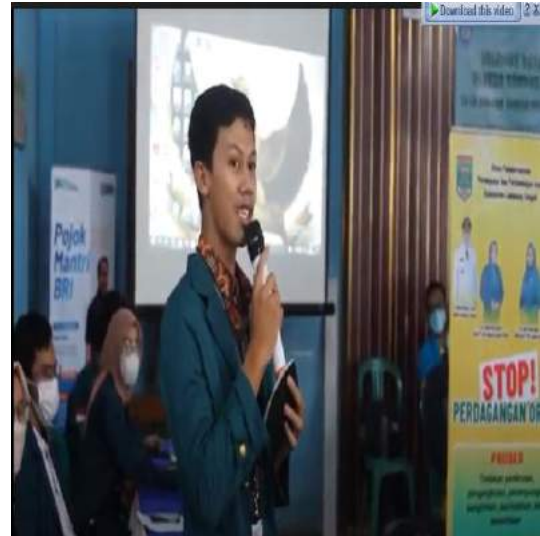
Gambar 2. Sambutan dari Ketua HIMBIO