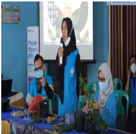
Gambar 4. Penyampian Materi Penyuluhan