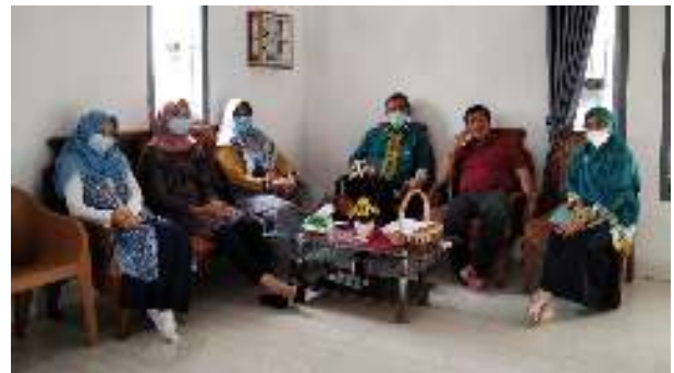
Gambar 1. Pengurusan Perizinan Kegiatan Pengabdian Kepada Masyarakat

Tim dosen pengabdian kepada masyarakat mengunjungi Desa Paguyuban untuk mengurus perizinan pelaksanaan kepada pengabdian kepada masyarakat tentang Pemanfaatan Digital Marketing Dalam Pemasaran Produk Para Pelaku UMKM di Desa Paguyuban Kecamatan Way Lima Kabupaten Pesawaran pada hari minggu tanggal 20 Juni 2021 (Gambar 1).