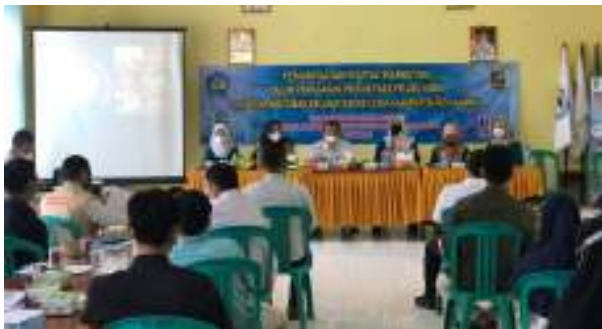
Gambar 5. Pembukaan oleh ketua tim PKM Universitas Lampung

Kemudian ketua tim Pengabdian Kepada Masyarakat Universitas Lampung Ibu Yuliana Saleh, S.P., M.Si. memperkenalkan anggota timnya dihadapan seluruh peserta (Gambar 5). Ketua tim menjelaskan alasan betapa pentingnya pelatihan ini dilaksanakan untuk para pelaku UMKM. Peserta diminta untuk dapat mengikuti pelatihan dengan sungguh-sungguh.