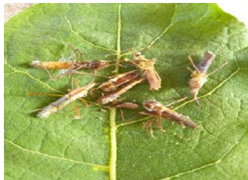
Gambar 5. Kemunculan Cendawan Beauveria Bassiana (Berwarna Putih) pada Walang Sangit