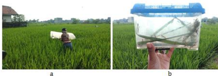
Gambar 2. (a) Proses Penangkapan Serangga Walang Sangit dan (b) Hasil Tangkapan Walang Sangit