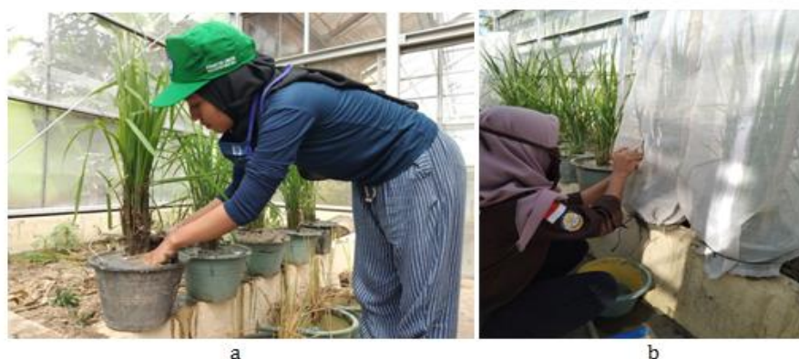
Gambar 3. (a) Sampel Pot Tanaman A1-A5 dan (b) Pembuatan Jaring Nilon untuk Mengurung Walang Sangit