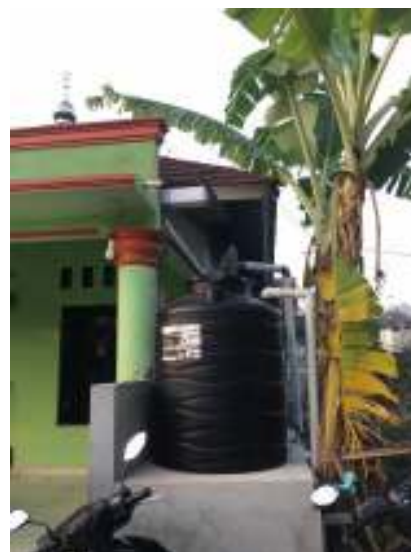
Gambar 3. Tampak Depan PAH, tangki penyimpanan air hujan