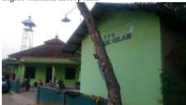
Gambar 1. TPQ Darrul Islam

Tujuan dari kegiatan pengabdian kepada masyarakat adalah memanfaatkan air langit atau air hujan dengan Sistem Pemanenan Air Hujan (PAH) untuk penyediaan air bersih bagi TPQ dan untuk irigasi tanaman hidroponik.