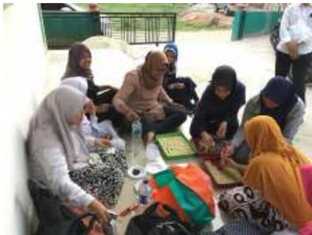
Gambar 13. Penyemaian benih kembali

Segera setelah pemanenan dilanjutkan dengan penyemaian benih kembali. Para orang tua siswa diajak untuk menyemai biji ke rockwall (Gambar 13). Dengan menimbang penyemaian di akhir Agustus 2019, maka diharapkan pemanenan dapat dilaksanakan di awal Oktober 2019.