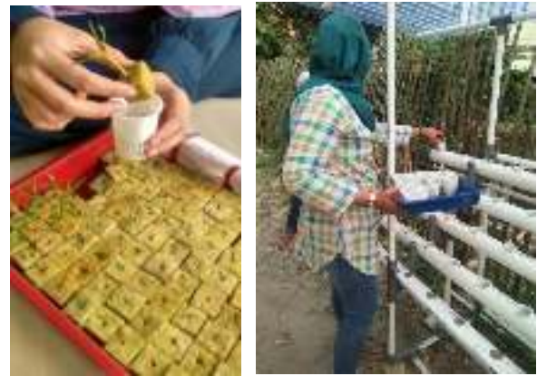
Gambar 6. (a) Rockwall dengan bibit tanaman yang telah tumbuh, (b) Netpot dipindahkan ke lubang hidroponik

Benih yang telah disemai di atas rockwall dan telah tumbuh beberapa sentimeter, kemudian dimasukkan ke dalam netpot dan diletakkan ke dalam lubang yang telah disediakan pada hidroponik kit seperti ditunjukkan dalam Gambar 6.