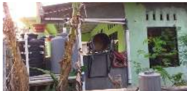
Gambar 2. Tampak samping sistem Pemanenan Air Hujan (PAH)

Pada saat ini sedang musim kemarau dan hujan sudah lama tidak turun. Jika nanti hujan turun, maka seminggu pertama air hujan tidak diperkenankan untuk masuk ke tangki air. Karena hujan seminggu pertama dianggap menyapu udara atau atmosfer yang terkena polusi maupun hujan asam. Setelah seminggu maka air hujan dapat dipanen menggunakan PAH.