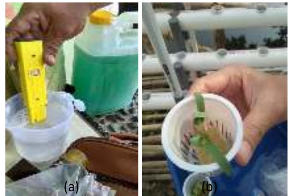
Gambar 7. (a) Pengecekan pH air hidroponik dan (b) Pengecekan pertumbuhan tanaman

Pengecekan kualitas air irigasi dilakukan untuk mengetahui pH dan TDS air yang mengalir di hidroponik, kecukupan air yang mengalir, tanaman apakah terpapar panas pagi yang cukup dan tidak terpapar panas sore yang berlebihan, serta kondisi pertumbuhan tanaman.