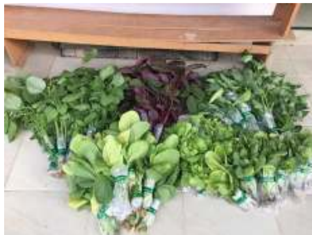
Gambar 12. Tanaman yang telah diikat dan siap dibagikan

Tanaman yang telah dipanen kemudian dikumpulkan (Gambar 10) dan bersama-sama dengan para wali murid dan pengajar mengikat