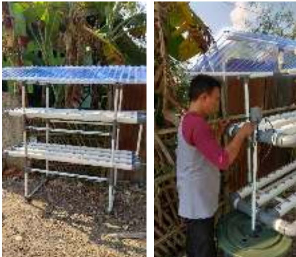
Gambar 4. Pemasangan Hidroponik Kit dan Saluran Irigasi

Komponen lain yang digunakan untuk hidroponik adalah netpot, rockwall dan timer. Netpot digunakan sebagai pot kecil berjaring, rockwall untuk penanaman dan timer untuk mengatur waktu pengairannya.