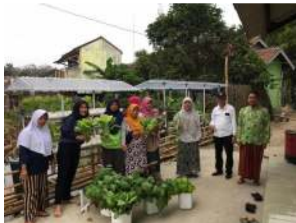
Gambar 10. Pengumpulan tanaman hasil panen