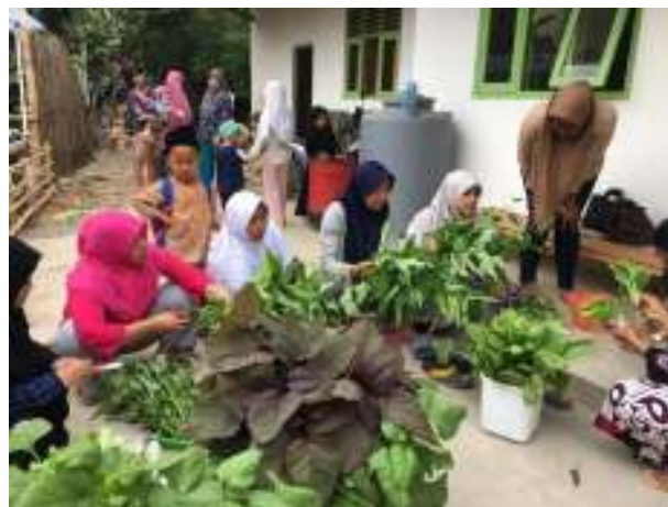
Gambar 11. Suasana pemanenan