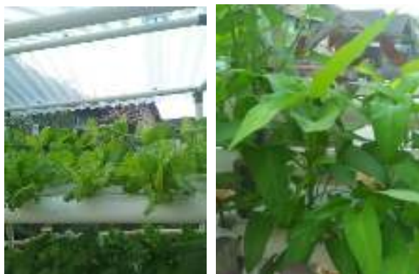
Gambar 9. Tanaman telah siap dipanen

Pemanenan dilakukan setelah tanaman cukup umurnya (Gambar 9). Untuk jenis tanaman bayam, kangkung, caisim, pakcoy, bayam merah maupun selada umur pemanenan sekitar 1 bulan. Di akhir Agustus 2019 telah dilakukan pemanenan pertama dari pertanian hidroponik di TPQ Darrul Islam..