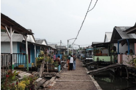
Gambar 1. Kondisi Kampung Cungkeng, Bandar Lampung (survey lapangan, 2021)

Secara demografis, Kawasan Kota Karang yang merupakan kelurahan dari Kampung Cungkeng seluas 30 Hektar dan terbagi menjadi 2 lingkungan, dimana lingkungan 1 yang terdiri dari 12 RT dan lingkungan 2 yang terdiri 10 RT. Kampung Cungkeng berada pada Lingkungan 2. RT terdekat dari pantai adalah RT 05, RT 06, RT 07 yang mencakup 16 Ha dan banyak dihuni oleh masyarakat etnis Bugis. Menurut peta administrasi Kota Karang, Kampung Cungkeng dikategorikan sebagai area kumuh yang dihuni oleh 2061 jiwa dari 141 KK. Letak geografi Kampung Cungkeng yang sangat dekat dengan pantai dan berdekatan dengan Pulau Pasaran, maka kampung ini memiliki potensi sebagai sentra produksi ikan asin di Bandar Lampung. Sehingga banyak rumah terletak di pantai bahkan di atas air laut.