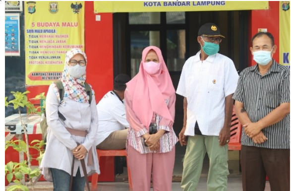
Gambar 3. Koordinasi dengan Lurah Kota Karang (survey lapangan, 2021)

Pengembangan destinasi wisata budaya merupakan salah satu cara untuk menjadikan lingkungan lebih maju, baik dan berguna bagi semua kalangan. Kampung Cungkeng yang memiliki potensi pariwisata budaya etnis Bugis, bisa dijadikan komoditas melalui strategi yang tepat untuk desa wisata. Selain itu, perkembangan teknologi berbasis digital yaitu melalui social media dapat berfungsi sebagai sarana promosi Kampung atas air di Kampung Cungkeng. Keterlibatan masyarakat dalam memutuskan konsep wisata bagi kawasannya, dapat dilakukan pada level RT hingga kelurahan/desa, dimana tetap menerima masukan dan pandangan dari Camat, Walikota dan akademisi (dalam hal ini Arsitektur Unila).