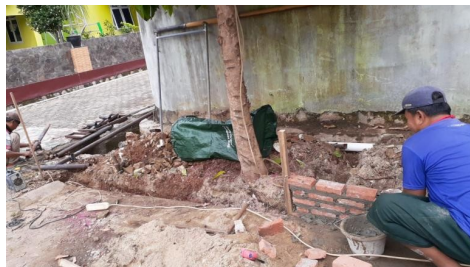
Pembuatan tempat pemilahan sampah

Kegiatan lebih lanjut diperlukan terutama pada pemilahan sampah plastik yang merupakan sampah anorganik, dan pada pengolahan sampah organik menjadi produk yang lebih bermanfaat yaitu kompos.