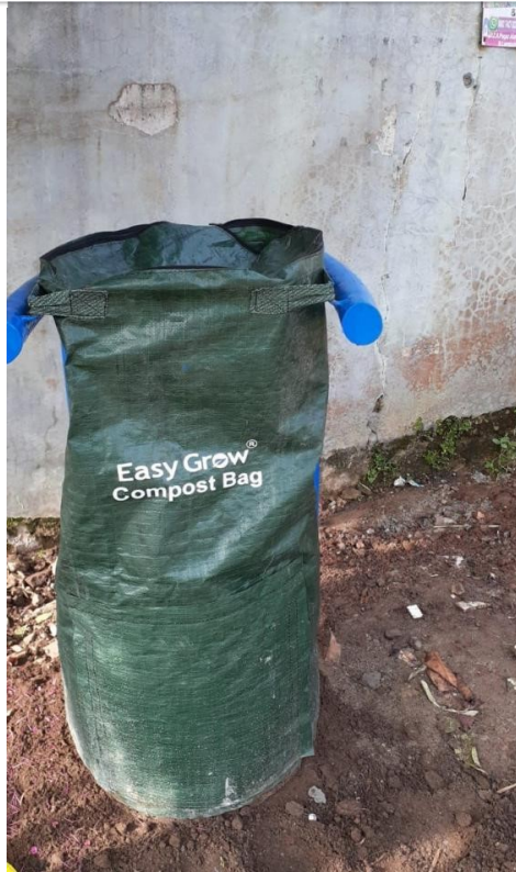
Compost bag yang dibagikan

Di Bandar Lampung, terdapat Komunitas Sahabat Lingkungan (KSL) yang memiliki kegiatan peduli lingkungan salah satunya pemilahan sampah. Usaha ini digerakkan oleh wakil kelompok yang bernama Bu Murni dan teman temannya di Bandar Lampung. Di sini kita bisa melihat proses pemilahan sampah secara sederhana sudah menjadi kebiasaan setiap anggota kelompok.