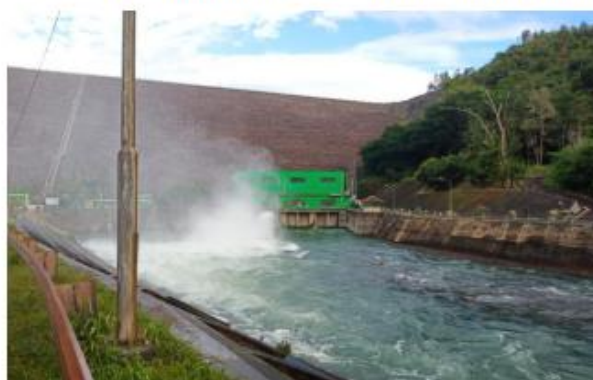
Gambar 3. PLTA Bendungan Batutege

Berikut adalah foto ketika saya mengunjungi PLTA Bendungan Batutege :