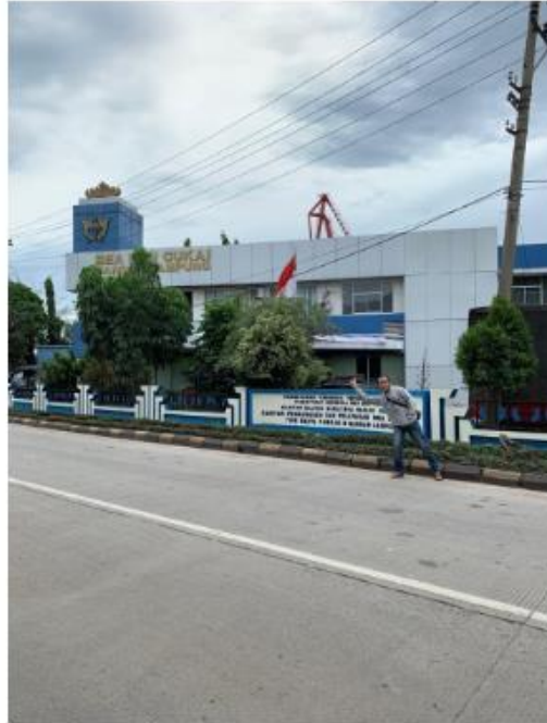
Gambar 3. Kantor Bea Cukai (Diambil Pada Desember 2020 Pukul 14:10 Menggunakan Gadget Iphone XR)

Karena terdiri dari berbagai macam kegunaan, Terminal ini tentu saja multifungsi dan juga dapat menghasilkan banyak uang untuk kota Bandar Lampung, jika terminal ini dikembangkan lebih lanjut tentu saja dapat menghasilkan pendapatan yang lebih banyak lagi untuk Kota Bandar Lampung