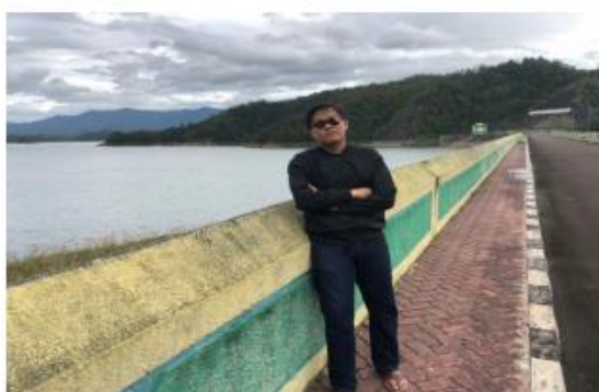
Gambar 1. Jembatan Tembok Cina ( Foto ini diambil pada tanggal 06 November 2020, Bendungan Batutegi, Vivo V11 )

Berikut adalah foto-foto ketika saya mengunjungi jembatan tembok cina ini :