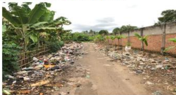
Gambar 6. Jalan yang banyak sampahnya

Berikut adalah foto dari sampah yang berserakan di jalanan :