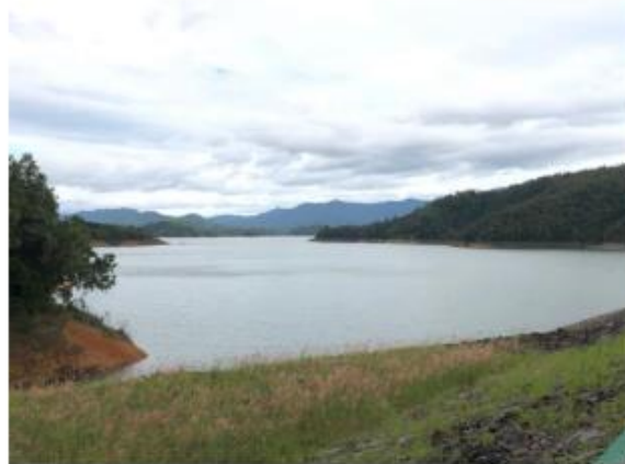
Gambar 2. Jembatan Tembok Cina

( Foto ini diambil pada tanggal 06 November 2020, Bendungan Batutege, Vivo V11 )