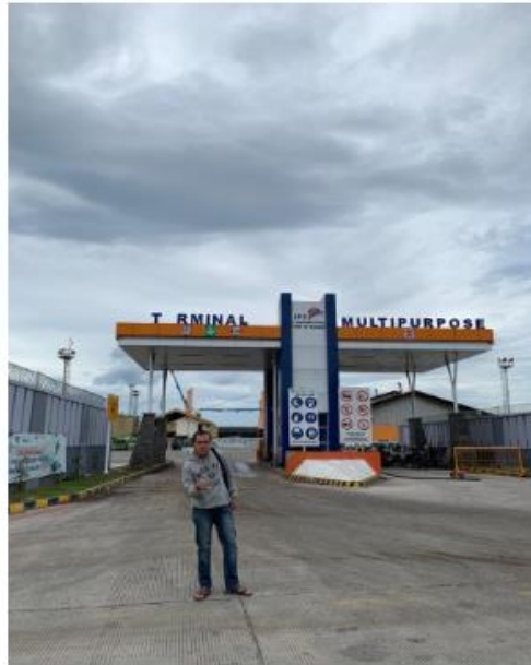
Gambar 2. Terminal MultiPurpose (Diambil Pada Desember 2020 Pukul 14:05 Menggunakan Gadget Iphone XR)

Jika mereka melakukan kesalahan, tidak hanya akan melukai pegawai karena alat-alat yang berada di dalamnya adalah alat berat sehingga berbahaya bagi pegawai, akan tetapi jika sampai satu container rusak maka kerugian yang dialami juga bisa sangat banyak dan merugikan baik untuk perusahaanya maupun pelabuhan itu sendiri. Jika Container Freight Station ini semakin dikembangkan maka sudah pasti akan memberikan pemasukan yang lebih besar untuk kota Bandar Lampung