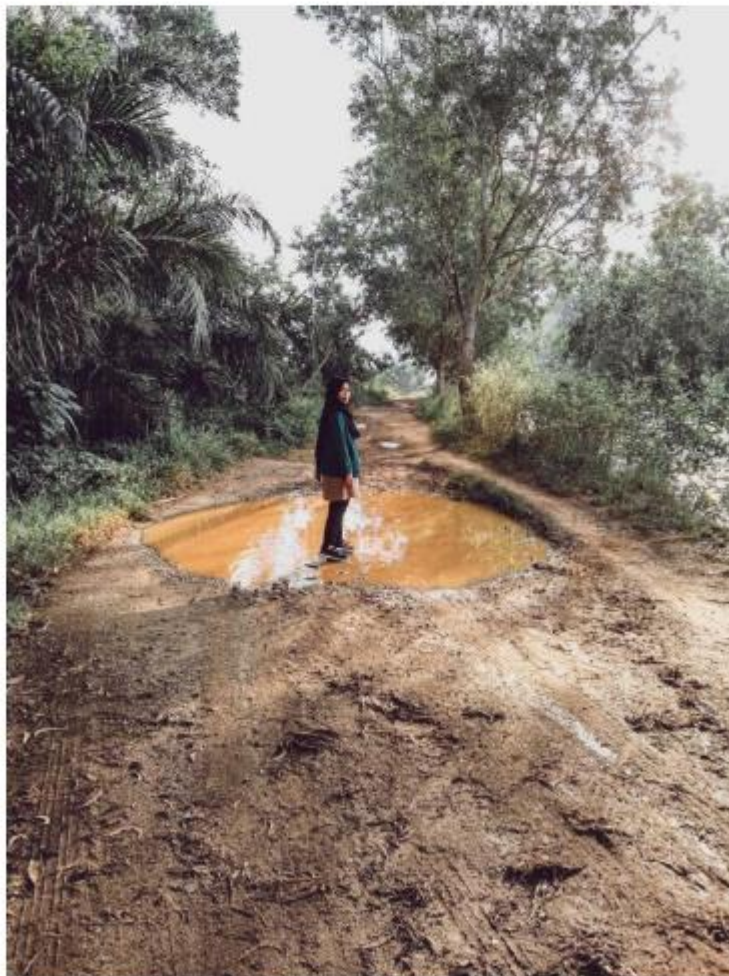
Trimurjo, 4 Desember 2020

Jalan merupakan suatu kebutuhan bagi masyarakat untuk memudahkan aktivitas masyarakat juga sebagai penghubung antar daerah. Oleh karenanya, jalan merupakan suatu hal yang penting. Akan tetapi, jika dilihat lagi masih banyak sekali daerah-daerah yang akses jalannya rusak. Contoh nya, daerah Penulis.