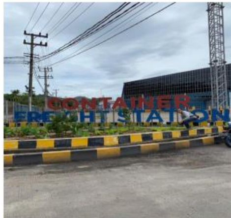
Gambar 1. Container Freight Station (Diambil Pada Desember 2020 Pukul 14:00 Menggunakan Gadget Iphone XR)

Potensi yang saya ambil disini adalah pelabuhan yang ada di panjang, pelabuhan ini adalah pelabuhan terbesar di Provinsi Lampung. Pelabuhan ini sudah berdiri sejak lama dan juga dekat dengan bypass yang banyak dilalui oleh truk bermuatan besar. :