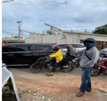
Gambar 5. Pembangunan Fly Over di Jalan Sultan Agung (Diambil Pada Desember 2020 Pukul 14:55 Menggunakan Gadget Iphone XR)

Sebelum pembangunan fly over diadakan, biasanya kemacetan di jalan ini hanya dikarenakan kereta dan sebenarnya menurut para ahli jika fly over selesai dibangun tidak akan begitu membantu menangani kemacetan