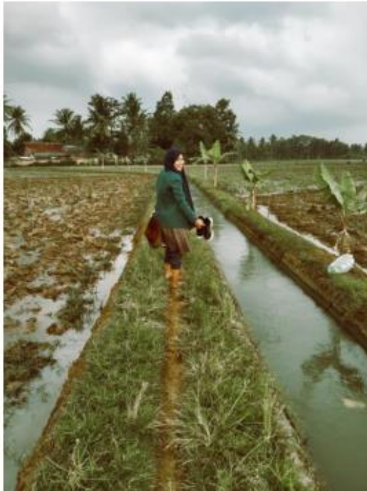
Trimurjo, 2 Desember 2020