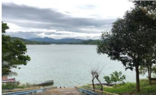
Gambar 4. Dermaga Bendungan Batutege

Berikut adalah foto ketika saya mengunjungi Dermaga Bendungan Batutege :