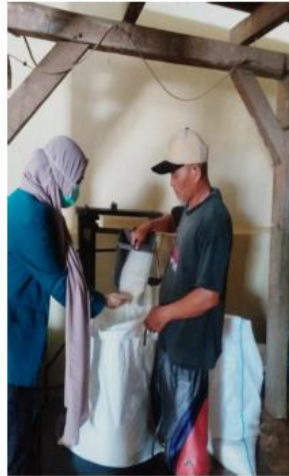
Trimurjo, 1 Desember 2020

Lokasi sawah untuk pengambilan foto diatas merupakan sawah yang lokasinya berada di belakang rumah penulis, sehingga kurang lebih penulis paham bagaimana kondisinya. Panen tahun ini bisa dibilang kualitas gabah yang dihasilkan sangat memuaskan, karena cuaca yang bagus tidak banyak menimbulkan kerusakan pada padi. Akan tetapi, selama masa pandemi ini harga rata-rata gabah di petani dan di tingkat penggilingan menurun yaitu kurang lebih sekitar Rp 5.000,00 per kg dan harga beras nya sendiri hanya mencapai Rp 8.300,00 per kg.