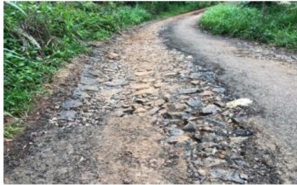
Gambar 5. Jalan yang rusak

Berikut adalah foto jalan rusak atau berlobang yang saya ambil :