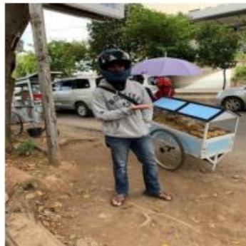
Gambar 6. Penjual Di Ruas Jalan Sultan Agung (Diambil Pada Desember 2020 Pukul 15:00 Menggunakan Gadget Iphone XR)

Kemacetan di Jalan Sultan Agung disebabkan oleh adanya pembangunan Fly Over untuk menghindari rel kereta yang ada dibawahnya. Pembangunan Fly Over ini membuat ruas jalan menjadi semakin sempit sehingga timbulah kemacetan di salah satu jalan ramai di kota Bandar Lampung. Pembangunan Fly Over ini juga berjalan lambat sehingga memperparah keadaan.