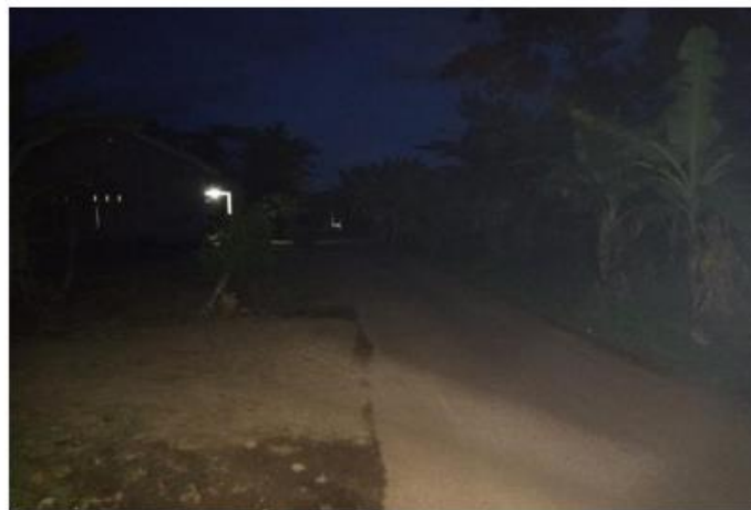
Gambar 7. Jalan yang kurang lampu jalanan ( Foto ini diambil pada tanggal 05 November 2020, Pekon Tekad, Vivo V11)

Berikut adalah foto dari jalanan yang kurang lampu jalanan saat malam hari :