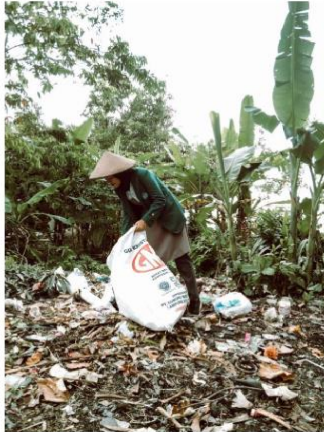
Trimurjo, 2 Desember 2020

Sampah merupakan salah satu permasalahan yang tidak kunjung selesai dan bahkan belum ada cara penanganannya. Hal tersebut dikarenakan masyarakat sudah terbiasa membuang sampah pada lahan kosong yang ada di depan ataupun belakang rumah mereka sendiri. Pada gambar di atas merupakan tempat pembuangan sampah dari seluruh rumah tangga di daerah tempat tinggal saya. Letak tempat pembuangan sampah tersebut adalah ditengah tengah pemukiman, akibatnya seringkali menimbulkan aroma yang tidak sedap. Terlebih lagi saat musim hujan selain menimbulkan aroma tidak sedap, penumpukan sampah tersebut akan menghambat aliran air sehingga tercipta genangan sampah yang pastinya juga menimbulkan berbagai macam penyakit, salah satunya adalah demam berdarah.