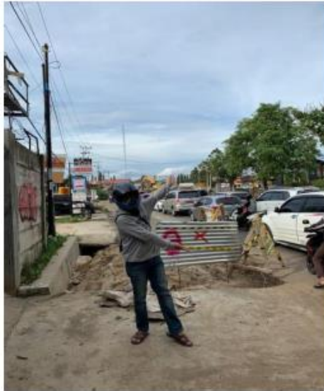
Gambar 4. Kemacetan Di Sultan Agung (Diambil Pada Desember 2020 Pukul 14:50 Menggunakan Gadget Iphone XR)

Setelah melihat potensi yang dimiliki oleh kota Bandar Lampung, lalu saya bergerak untuk mencari hambatan yang ada di kota Bandar Lampung. Hambatan yang dimiliki Bandar Lampung pun sebenarnya cukup banyak, akan tetapi saya mengambil hambatan yang paling sering saya rasakan.