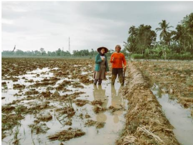
Trimurjo, 04 Desember 2020

Pertanian merupakan potensi terbesar di kecamatan Trimurjo. Banyak berbagai jenis tanaman pangan yang ditanam, baik itu tanaman palawija, umbi-umbian dan juga padi. Namun, mayoritas masyarakat banyak yang menanam padi karena itu penulis ingin mendeskripsikan bagaimana pertanian padi menjadi sumber potensi di Kecamatan Trimurjo. Untuk Luas sawah nya sendiri, menurut data dari BPS Lampung Tengah, kecamatan Trimurjo memiliki luas sawah mencapai 4.038 ha.