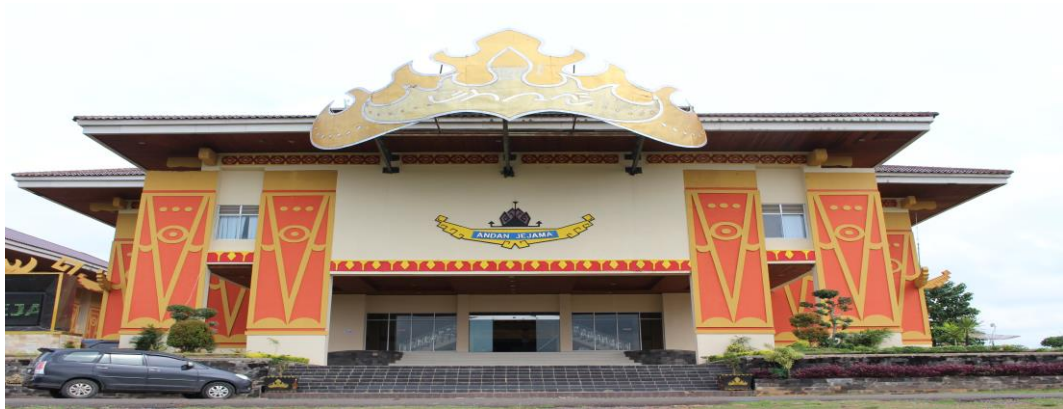
Kantor Bupati Pemerintah Kabupaten Pesawaran