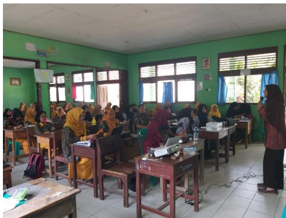
Gambar 3. Simulasi pembelajaran di kelas dengan perangkat pembelajaran literasi bencana

Pada tahap akhir, pemateri menyajikan simulasi pembelajaran dikelas terkait pelaksanaan rencana pembelajaran yang telah dibuat. Hal ini dilakukan guna memberikan gambaran kepada guru bahwa hampir setiap materi ipa dapat dikaitkan dengan literasi kebencanaan (Gambar 3).