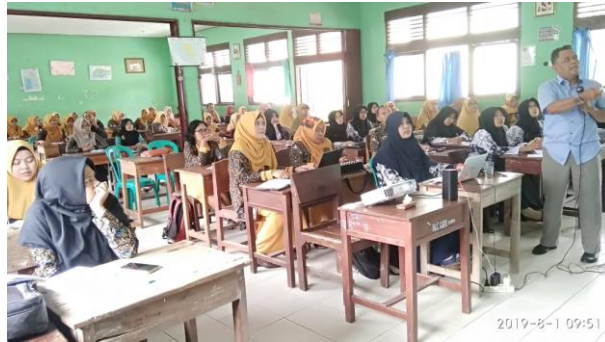
Gambar 1. Pemaparan materi oleh Ketua Tim Pengabdian

teknis berupa pembekalan pengetahuan mengenai pengintegrasian tanggap bencana pada pembelajaran melalui perangkat pembelajaran yang dibuat oleh guru.