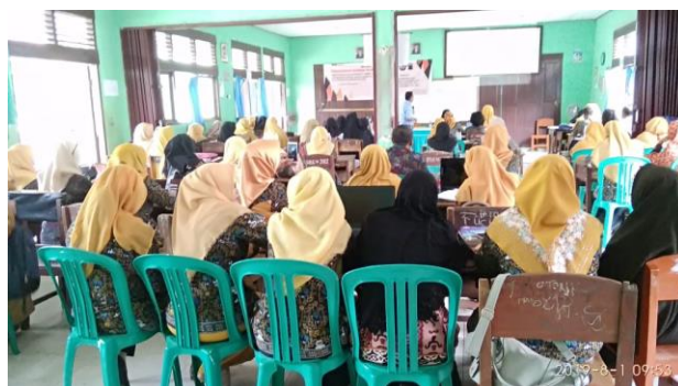
Gambar 5.2. Guru melakukan diskusi pemetaan analisis Ki dan KD

Pada tahap ini, pemateri membagikan SKL dan guru diminta untuk melakukan pemetaan dan analisis KI dan KD dengan bimbingan pemateri serta draft perangkat pembelajaran (Gambar 2).