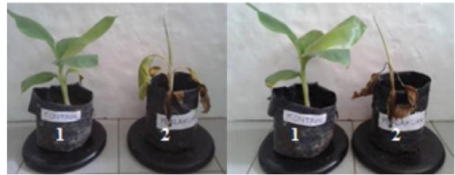
Gambar 2. Hasil inokulasi tanaman pisang : 7 hari setelah inokulasi (a2) dan 14 hari setelah inokulasi (b2) dan kontrol (a1 & b1)

Senyawa khas yang terdapat pada bunga gulma siam yaitu flavonoid (Collinz dan Franzblau, 1997 dalam Ulpa, 2008). Senyawa flavonoid dilaporkan dapat bersifat sebagai koagulator protein. Protein yang mengalami koagulasi akan nonfungsi menyebabkan kerusakan dinding sel bakteri (Sulastrianah dkk., 2014). Selain itu, flavonoid juga bekerja langsung pada membran