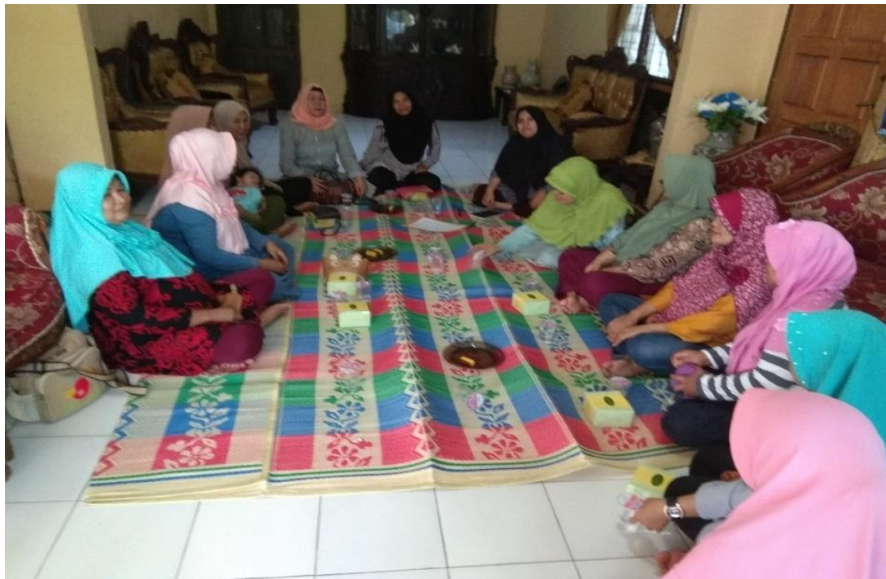
Gambar 2. Diskusi dan Penyampaian Materi