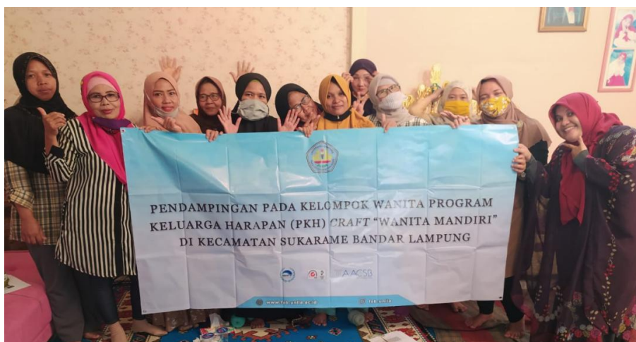
Gambar 3. Peserta Pendampingan