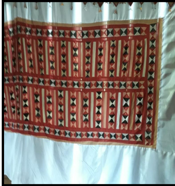
Gambar 2.13 Coccok

Coccok/Tegak merupakan motif Belah Ketupat yang berbentuk tegak lurus keatas, dalam satu motif ini biasanya satu baris full berjejer dan tegak keatas berurutan.