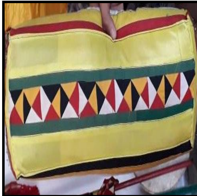
Gambar 2.8 Galang Sila

Galang Sila sila berfungsi untuk menggalang kaki saat duduk di kasur (singgasana), yang diletakkan di samping tempat duduk tepat dibawah kaki saat duduk bersila.