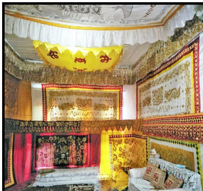
Gambar 2.2 Leluhukh

Leluhukh biasanya terdapat moti belah ketupat dimana dalam penempatannya bisa dipasang di bagian atap-atap tepat di atas ruangan tempat singgasana pengantin yang berfungsi untuk menghiasi atap-atap ruangan upacara adat.