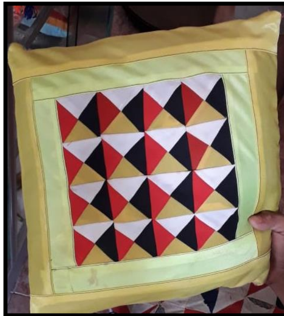
Gambar 2.7 Ikat Banggol

Ikat Banggol berbentuk bantal kecil persegi empat yang berfungsi tempat duduk pengantin saat duduk diatas kasur (singgasana pengantin).