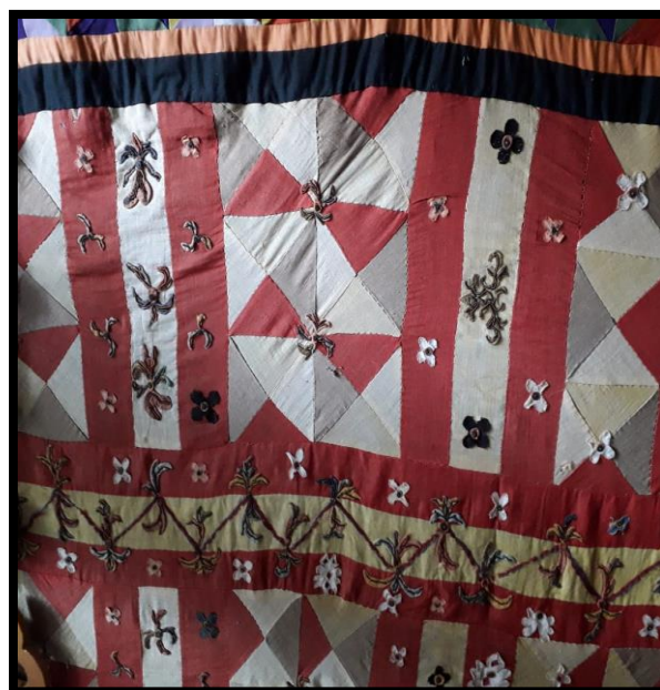
Gambar 2.10 Lelamban

Lelamban merupakan jenis motif yang memiliki ciri khas persegi panjang keatas dan diapit oleh tiga garis berwarna.