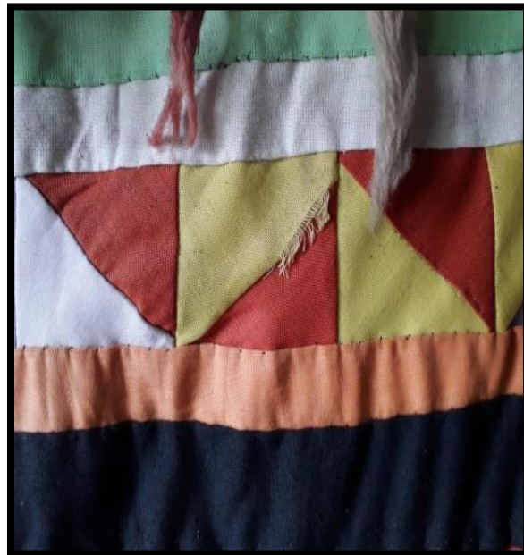
Gambar 2.11 Kakeris

Kakeris merupakan motif Belah Ketupat yang bentuk motifnya tidak beraturan (zig-zag).