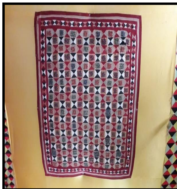
Gambar 2.12 Pippon

Pippon merupakan motif Belah Ketupat yang memiliki variasi selang-seling dalam satu motif full , biasanya motif ini gabungan dari dua motif yang berbeda.