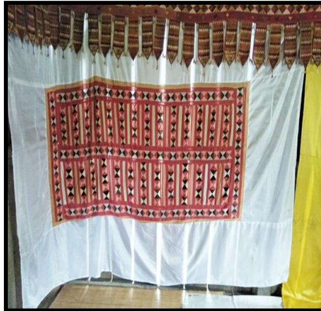
Gambar 2.1 Lalidung