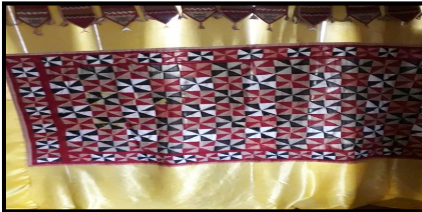
Gambar 2.9 Puttut Manggus

Puttut Manggus merupakan salah satu jenis variasi motif Belah Ketupat. Terlihat sangat jelas perbedaan antara motif Belah Ketupat biasa dengan puttut manggus . Motif puttut manggus ini menggunakan 8 (delapan) unsur potongan dari warna yang berbeda, karena motifnya mirip dengan buah manggis pada bagian kulit bawah yang tergabung membentuk formasi lingkaran dan menggambarkan jumlah dari isi manggis itu sendiri.