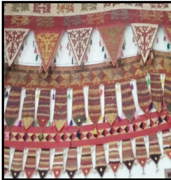
Gambar 2.3 Tikhai

Tikhai adalah hiasan yang dipergunakan untuk menghiasi ruangan (dinding) pada saat akan ada acara adat khitanan maupun pernikahan.