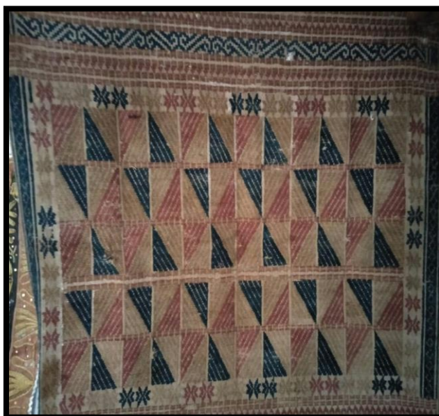
Gambar 2.6 Kain Tappan

Biasanya kain Tappan ini digunakan untuk membungkus sesuatu yang berupa tanda pemberitahuan saat melakukan larian. Pemberitahuan itu dapat berupa uang atau surat yang di tujukan kepada keluarga si gadis dan dibungkus dengan kain ini. Kain ini juga berfungsi untuk lamaran.