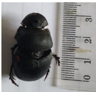
Gambar 5. Spesies Catharsius molossus

Spesies Catharsius molossus memiliki warna hitam dengan bentuk penampakan jika dari atas terlihat bundar dengan bentuk kepala seperti memiliki moncong yang terdapat benjolan seperti tanduk yang memudahkan spesies Dungbeetle ini untuk menggali tanah. Kumbang ini ditemukan hamper merata diantara naungan dan diluar naungan, sesuai dengan penelitian yang dilakukan Rahmawati dkk