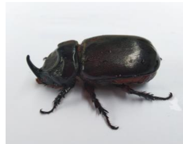
Gambar 6. Spesies Oryctes rhinoceros

Spesies ini memiliki perbedaan mencolok dengan spesies lainnya, dimana pada spesies ini terdapat tanduk yang jelas dilihat pada ujung kepalanya, dengan warna coklat tua sebagian besar bagian tubuhnya dan memiliki 6 kaki yang dapat berfungsi untuk menggali tanah serta hinggap di dahan-dahan pohon, sehingga spesies ini tidak hanya dapat ditemukan pada feses satwa dan dapat di temukan juga pada tanaman seperti palem-paleman yang dapat menjadi hama (Bintang dkkk, 2015). Penelitian yang dilakukan Indriyanti dkk (2017) mengemukakan, selain ditemukan menjadi hama pada tanaman palem-paleman spesies ini juga menjadikan tumpukan kotoran sapi yang dibiarkan menjadi tempat untuk kumbang betina spesies Oryctes rhinoceros meletakkan telur dan berkembang biak.