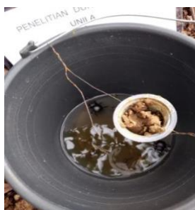
Gambar 2. Dung Trap

Metode yang digunakan pada penelitian ini adalah metode perangkap tinja ( Dung trap ) yaitu dengan menanam jebakan menggunakan ember yang berisi air dan dikaitkan gelas plastik berisi feses pada permukaan ember (Helmiyetti dkk, 2015).