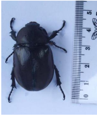
Gambar 4. Spesies Aphodius marginellus

Spesies Aphodius marginellus memiliki bentuk oval dengan kaki berjumlah 6 yang memiliki fungsi untuk menggali tanah pada umumnya, dengan warna coklat dan banyak ditemukan pada tegakan pohon yang memiliki bau manis seperti pada penelitian yang banyak ditemukan pada trap dibawah tegakan tanaman kopi. Menurut Priandawiputra dkk (2020) Dungbeetle ini tergolong kedalam dwellers . Dungbeetle yang tergolong kedalam dwellers atau sebagai kumbang penghuni yang berarti kegiatan-kegiatan kumbang ini dilakukan di dalam kotoran seperti makan dan bereproduksi (Handayani dkk, 2017). Kumbang ini ditemukan diberbagai tempat di Indonesia diantaranya di Sumatera Barat, Jawa Barat, Kalimantan Barat, Banten dan Sulawesi Tenggara yang merupakan hutan tropis asia.