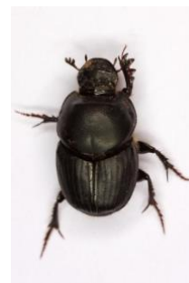
Gambar 3. Spesies Onthopagus sp

Spesies Onthopagus sp memiliki warna hitam, dengan bentuk kepala dibagian ujungnya terdapat moncong menjorok kedepan seperti halnya dengan spesies Catharsius molossus namun tidak terdapat tanduk pada moncongnya melainkan terdapat 2 antena. Spesies ini menurut Aruchunnan dkk (2016), merupakan spesies yang terdapat banyak di hutan hujan tropis yang dapat menjadi indikator lingkungan yang masih baik karena spesies ini dapat hidup baik di daerah terganggu karena spesies ini juga dapat ditemukan pada daerah yang terganggu oleh aktifitas manusia, dan dalam Dewara dkk (2020), menyebutkan spesies ini tidak menyukai kondisi cuaca panas, hal ini sesuai dengan penelitian yang dilakukan karena spesies ini lebih banyak ditemukan pada arboretum 11 dan 12 dimana di arboretum tersebut lebih rimbun vegetasinya dan kondisi lantai hutan yang lembab yang juga disukai spesies ini (Mario dan Gonzalo, 2019).