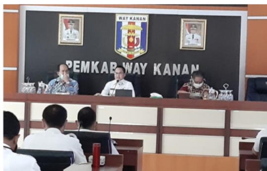
Gambar 2. Kegiatan Ceramah Tentang Pengantar Konsep Policy Brief

Ketiga , sifat buatan dari masalah dalam arti bahwa masalah kebijakan memang merupakan produk penilaian subyektif namun bisa didefinisikan sebagai kondisi sosial yang obyektif. Masalah tidaklah berada di luar manusia dan kelompoknya, artinya suatu permasalahan yang ada di dalam masyarakat dengan sendirinya merupakan masalah kebijakan. Keempat , dinamika masalah kebijakan akan berkembang sehingga solusi terhadap masalah bisa berubah di waktu atau lokasi yang berbeda. Masalah publik yang sama belum tentu dapat dipecahkan dengan kebijakan yang sama pula, terutama saat konteks lingkungannya berbeda.