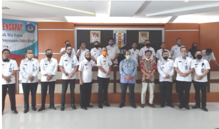
Gambar 4. Action Plan: Penyusunan dan Presentasi Policy Brief

suatu kebijakan dipilih sehingga fungsi ini menjawab apakah jenis dan berapa banyak sumber daya yang dibutuhkan untuk menjalankan suatu kebijakan.