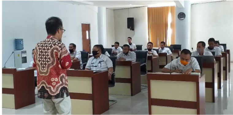
Gambar 3. Penyuluhan Identifikasi Isu Kebijakan