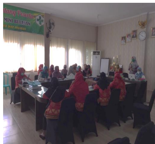
Gambar : kegiatan pemberian pendidikan kesehatan

Kegiatan pengabdian kepada masyarakat berjalan dengan baik dan lancar. Kegiatan ini Kegiatan pengabdian kepada masyarakat berjalan dengan baik dan lancar. Kegiatan ini dihadiri oleh 50 peserta yang merupakan kader di wilayah Puskesmas Sukaraja Bandar Lampung. Peserta sangat antusias dalam mengikuti kegiatan dapat dilihat dari perhatian peserta pada saat pemberian materi dan antusiasme peserta dalam mencoba melakukan pengukuran antropometri serta role play KIE mengenai stunting untuk mengajak keluarga balita membawa balita ke posyandu. Peserta juga sangat aktif dalam diskusi tanya jawab mengenai materi yang disampaikan.