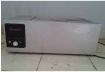
Gambar 1. Water batch

Penelitian ini dilakukan pada bulan Desember 2012 – April 2013. Bahan yang digunakan pada penelitian ini adalah rumput laut Eucheuma Spinosum yang berasal dari Madura, Jawa Timur, Sodium hidroksida (NaOH) 40%, Hidrogen peroksida (H 2 O 2 ) 6%, Aquades (air suling), Aseton 99,99 % (ml/ml). alat yang digunakan pada penelitian ini adalah Water Batch , digital balance, gelas piala, kain saring, pipet, stirer .