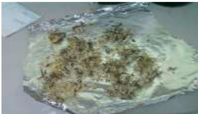
Gambar 8. Residu Rumput Laut Eucheuma Spinosum