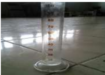
Gambar 4. Gelas Piala