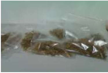
Gambar 5. Sintesis Selulosa