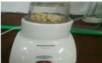
Gambar 7. Proses Penghalusan