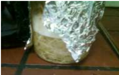
Gambar 6. Rumput Laut Eucheuma Spinosum