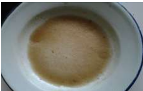
Gambar 9. Membran Selulosa Asetat