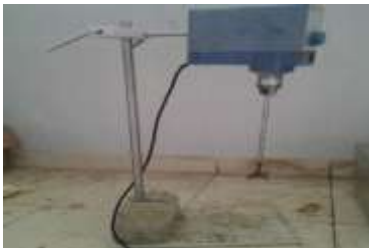
Gambar 2. Stirer