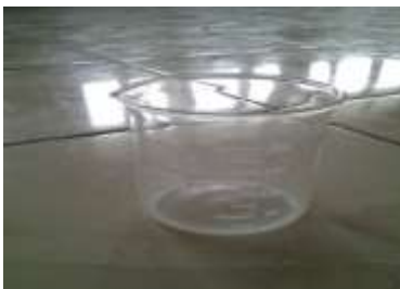
Gambar 3. Gelas beker