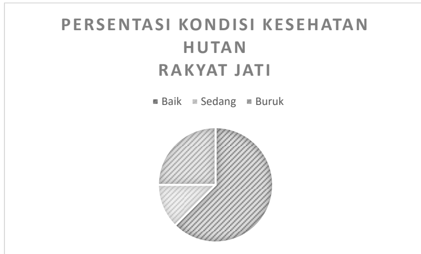
Gambar 3. Persentasi kondisi Kesehatan hutan rakyat jati

Pemilik atau pengelola hutan rakyat jati di Desa Rulung Helok Kecamatan Natar ini memiliki tujuan utamanya menghasilkan kayu untuk di pasarkan ke luar pulau sumatera sebagai kebutuhan bahan baku industri. Bahan baku industri di pulau jawa anatra lain untuk bahan baku bangunan dan perlengkapan rumah tangga. Pemanfaatan hutan rakyat melalui penyediaan bahan baku dalam menopang industri kehutanan menjadi suatu realitas dalam pembangunan kehutanan di Indonesia saat ini (Safe'i, 2017). Hal tersebut membuat kondisi pertumbuhan tegakan jati harus baik. Kondisi tersebut dapat diketahui melalui status kesehatan hutan rakyat jati yaitu dengan mengetahui tingkat produktivitas pohon jati yang berada dalam hutan rakyat tersebut.