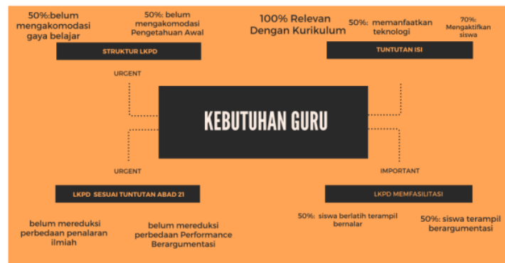
Gambar 1. Analisis Kebutuhan Guru

LKPD yang memfasilitasi ragam gaya belajar dan pengetahuan awal dalam proses pembelajaran berperan penting dalam rangka mencapai keterampilan abad 21. LKPD juga menjadi aspek yang penting dan utama untuk membantu tercapainya tujuan pembelajaran. Tuntutan LKPD menitikberatkan pada efisiensi proses pembelajaran dan dapat diaplikasikan dalam mengakomodasi berbagai gaya belajar dan tingkat pengetahuan awal siswa masih tergolong rendah. Adapun hasil penyebaran angket untuk melihat kebutuhan guru dapat dilihat pada gambar 1.