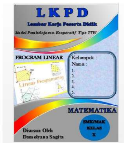
Gambar 5. Cover LKPD Sebelum Revisi Ahli Media

LKPD dengan model pembelajaran kooperatif tipe TTW yang telah disusun diserahkan kepada ahli materi dan media dengan menyertakan lembar penilaian. Berdasarkan perolehan skor kedua penilaian ahli materi dan ahli media, LKPD dengan model pembelajaran kooperatif tipe TTW berorientasi kemampuan pemahaman konsep matematis dapat digunakan di lapangan dengan sedikit revisi disarankan cover LKPD diberi margin kiri untuk penjilidan dan tulisan diperkecil sedikit.