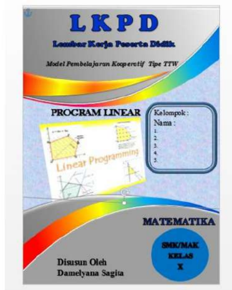
Gambar 6. Cover LKPD Setelah Revisi Ahli Media

Pembahasan penelitian ini dilakukan berdasarkan tahapan-tahapan pada penelitian pengembangan yang dimulai dari pengembangan model pembelajaran kooperatif tipe TTW sampai dengan uji ahli dan uji praktisi untuk melihat apakah perangkat pembelajaran yang dikembangkan layak digunakan. Berdasarkan hal diatas maka produk yang ingin dikembangkan berupa LKPD dengan model pembelajaran kooperatif tipe TTW. Dimulai dengan membuat draf produk awal memuat komponen sintak pembelajaran, silabus, RPP, LKPD, dan perangkat pembelajaran lain yang mendukung.