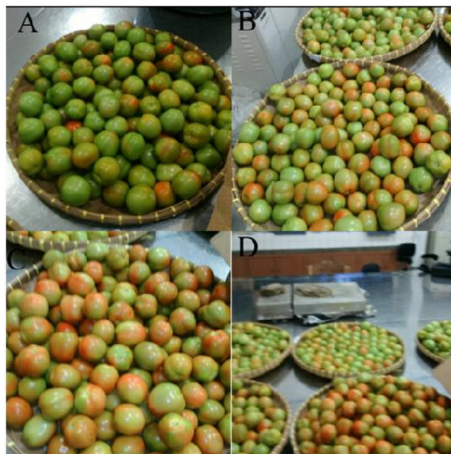
Gambar 2. Buah tomat umur 70 hari (A) buah tomat umur 75 hari (B) buah tomat umur 75-80 hari (C) semua buah tomat yang akan diukur kerusakan mekanisnya (D).

Buah tomat yang diambil langsung dari kebun di daerah Gisting tidak semuanya dalam keadaan baik untuk