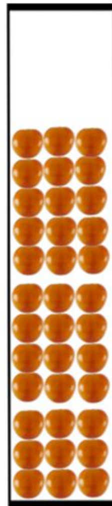
Gambar 1. Penyusunan buah tomat dalam 1 kotak pengujian

Alat yang digunakan dalam penelitian ini yaitu alat penggetar " shieve shaker ", digimatic caliper , tempat penyimpanan buah tomat dengan ukuran 16x18x75cm, timbangan digital dan alat tulis. Bahan yang digunakan dalam penelitian ini yaitu buah tomat skala turning dengan warna kulit buah hijau kekuningan sebanyak 50kg. Buah tomat disusun dalam masing-masing kotak dengan waktu penggetaran yang berbeda.