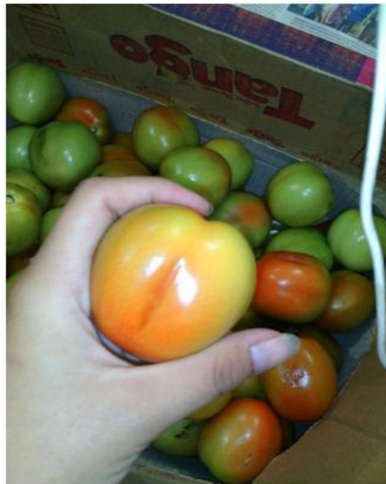
Gambar4. Buah tomat yang rusak setelah pemanenan

2kg buah tomat yang mengalami kememaran akibat pengangkutan dan tergores dengan palet penyimpanan. Gambar 4 merupakan buah tomat yang memar karena proses pengangkutan.