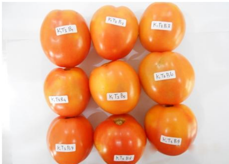
Gambar 7. Buah tomat yang masih bisa disimpan selama 5-7 hari