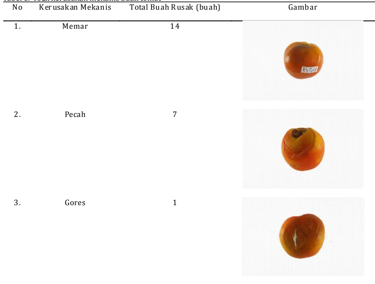
Tabel 1. Total kerusakan mekanis buah tomat

Persentase kerusakan mekanis tertinggi ada pada Kotak 2 pada tumpukan dengan 4 lapisan sebesar 4,23% dengan intensitas luas kerusakan mekanis nya sebesar 3,08%. Nilai standar deviasi untuk kerusakan mekanis dengan total rata-rata keseluruhan adalah sebesar 35%. Kesegaran buah merupakan dasar untuk menentukan mutu buah. Selain ketegaran, mutu didasarkan atas kesehatan, kebersihan, ukuran, bobot, warna, bentuk, kemasakan dan kebebasan dari bahan-bahan asing dan penyakit, kerusakan oleh serangga dan luka-luka mekanik. Dalam setiap tumpukan dengan kotak yang berbeda memiliki nilai kerusakan mekanis yang berbeda-beda, tentunya buah yang mengalami