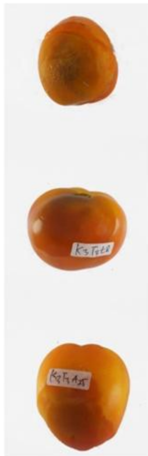
Gambar 5. Buah tomat yang mengalami kemeraman