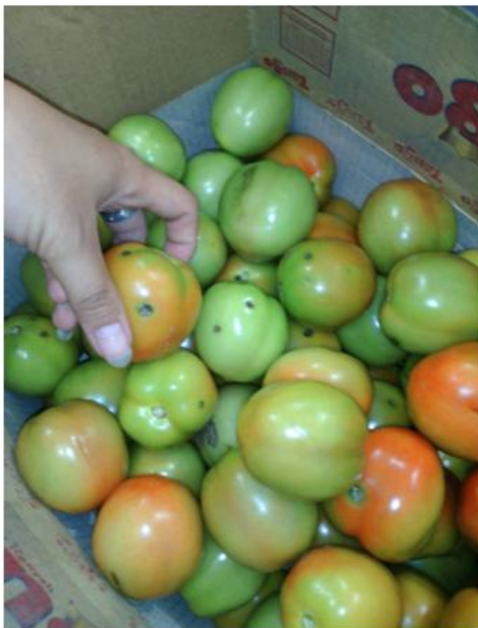
Gambar 3. Buah tomat yang terkena hama

Dalam wadah pemanenan (palet) ada 50kg buah tomat yang sudah dipanen. Namun tidak semua buah tomat yang dipanen tidak terkena hama. Dalam satu kali pemanenan, 20% hasil sortasi buah tomat tidak layak untuk digunakan dalam penelitian, 15% rusak karena ada yang terkena hama saat proses penanaman dan 5% rusak terkena wadah penyimpanan. Gambar 3 adalah gambar buah tomat yang terkena hama, sehingga dalam penelitian ini buah tomat ini tidak layak digunakan.