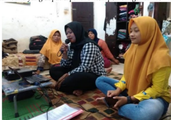
Gambar 5. Rembug Evaluasi Bersama Pokdarwis

suatu fasilitas. Bendahara berperan dalam mengkoordinasi pembayaran atau iuran jika memang diperlukan yang ditanggungkan kepada seluruh anggota Pokdarwis. Sekretaris berperan dalam mencatat setiap progres penyediaan dan pembangunan suatu fasilitas. Masyarakat berperan sebagai pelaku atraksi wisata dan membantu melaksanakan setiap perintah yang diberikan oleh ketua Pokdarwis dan mendukung dalam pemberian dana yang dapat dipakai untuk pembangunan fasilitas baru.