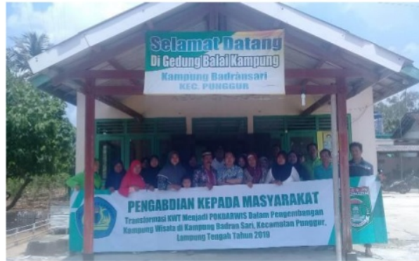
Gambar 1. Kegiatan Mapping dan Pengisian Form Pengajuan Pokdarwis

Institusi lokal ini juga menjadi bagian dari kehidupan sosial yang mempunyai karakteristik khas untuk hidup bersama-sama membentuk jaringan kehidupan sosial yang lebih kuat bersama masyarakat yang dipimpinnya, baik itu secara internal maupun eksternal. Dari sisi internal, institusi lokal bergerak dengan kekuatan modal sosial untuk mencapai tujuan kolektifnya. Sedangkan dari sisi eksternal, institusi lokal membangun kemitraan dengan stakeholders lain untuk mengakomodir peran dan partisipasinya dalam pembangunan (Santoso, 2008).