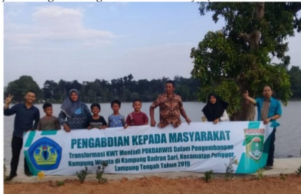
Gambar 4. Pendampingan Penyusunan Program Kerja Pokdarwis

Formulasi strategi pada umumnya disebut juga sebagai perencanaan strategis yang merupakan proses penyusunan perencanaan jangka panjang, oleh karena itu prosesnya lebih banyak menggunakan proses analitis (Priyadi, 2000). Pemilihan strategi tersebut juga perlu mempertimbangkan beberapa faktor seperti tanggap dengan lingkungan eksternal (Arif & Hossin, 2016), melibatkan keunggulan kompetitif (Lusticky & Kincl, 2012), dan sejalan dengan strategi stakeholders lainnya (Formica & Kothari, 2008).