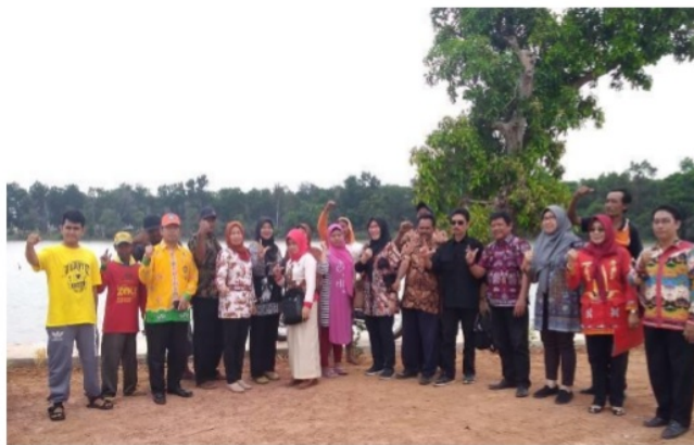
Gambar 3. Fasilitasi Kunjungan Dinas Pariwisata Provinsi Lampung dan Kabupaten Lampung Tengah

Kegiatan rembug Pokdarwis dalam rangka pengembangan kolaborasi dengan stakeholders ini dilaksanakan dengan melibatkan seluruh anggota Pokdarwis dengan mengundang Dinas Pariwisata Provinsi Lampung dan Dinas Pariwisata Kabupaten Lampung Tengah. Dalam kegiatan ini, Dinas Pariwisata Provinsi Lampung dan Dinas Pariwisata Kabupaten Lampung Tengah menyatakan bahwa sesuai Buku Pedoman Pokdarwis yang dikeluarkan oleh Kementerian Pariwisata pada 2012 dijelaskan secara detail mengenai mekanisme kerjasama Pokdarwis dengan stakeholders lain. Kegiatan pembangunan kepariwisataan, sebagaimana halnya pembangunan di sektor lainnya pada hakekatnya melibatkan peran dari seluruh stakeholders yaitu pemerintah, swasta dan masyarakat. Karena masing-masing stakeholders tidak dapat berdiri sendiri, maka ketiganya harus saling bersinergi dan melangkah bersama-sama untuk mencapai dan mewujudkan tujuan dan sasaran pembangunan yang disepakati.