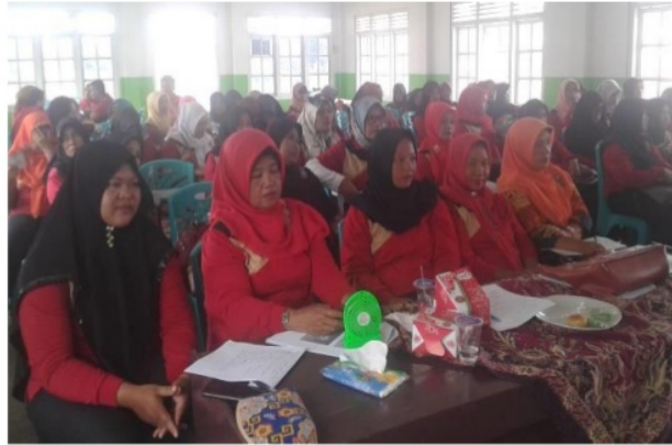
Gambar 2. Rembug Warga Pembentukan Pokdarwis