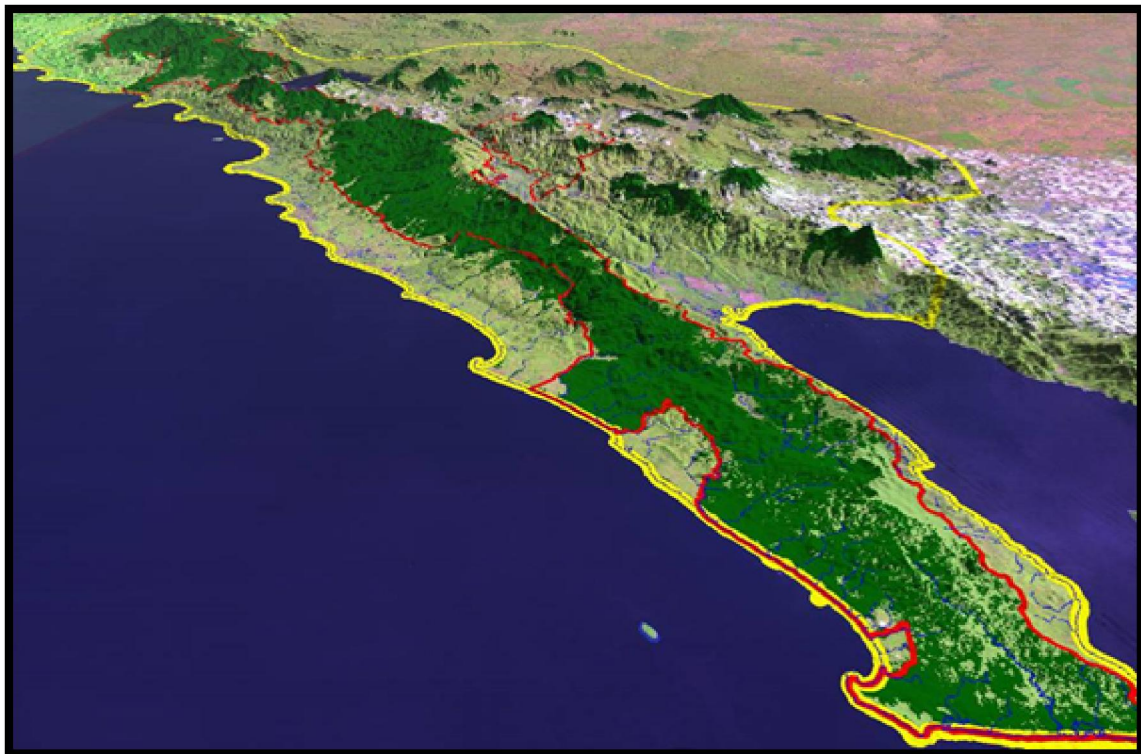
Gambar 1. Peta lokasi penelitian di Taman Nasional Bukit Barisan Selatan (TNBBS).

Sampel diambil pada masing-masing lokasi yang dibedakan menjadi lokasi atas, tengah, dan bawah. Dari ketiga lokasi di tentukan 4 titik untuk pengambilan sampel. Sampel cacing tanah diambil dengan membuat Monolith dengan luasan 50 cm x 50 cm ditandai dengan rantai pembatas. Kemudian digali dengan kedalaman