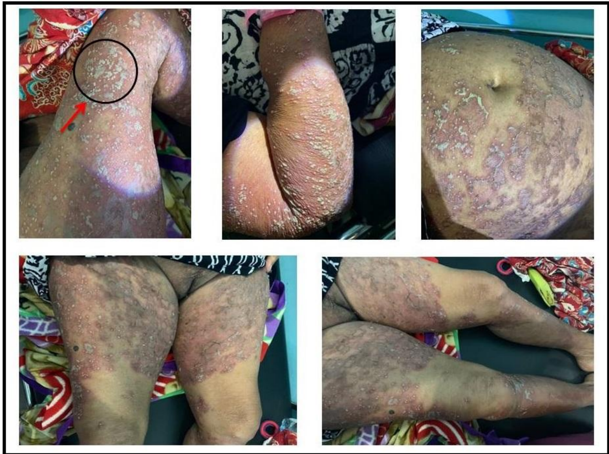
Gambar 1. Gambaran pustul berkonfluens membentuk lake of pus (panah merah)

Pada hari ke lima perawatan, tidak terdapat keluhan subjektif pada pasien. Seluruh kulit pasien sudah mengelupas dan tidak didapatkan bintil berisi nanah lagi. Status dermatologis didapatkan pada distribusi generalisata tampak makula eritem multipel plakat disertai skuama. Pasien mendapatkan terapi metilprednisolon peroral dengan dosis terbagi 32 mg (16-0-16 mg), ranitidin peroral dosis 1x150 mg, dan topikal betametason valerat cream 0,1% dalam campuran urea 10% cream.