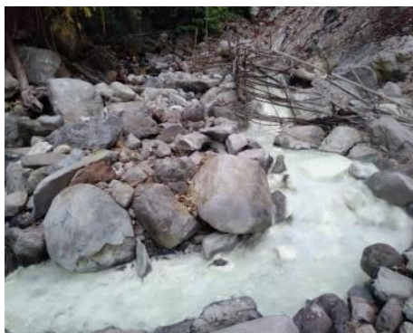
Gambar 3. Sumber mata air panas belerang Figure 3. Sulfur hot springs

Pengelola objek wisata Belerang Simpur memanfaatkan endapan-endapan belerang sebagai sabun (Gambar 4). Pembuatan sabun belerang dilakukan dengan cara mengendapkan bilah bambu di air panas selama beberapa hari hingga terisi endapan belerang. Sabun dicetak menjadi dua versi yang berukuran 200 gram dan dijual dengan harga Rp 5.000,00, sedangkan sabun yang berukuran 600 gram dijual dengan harga Rp 10.000,00. Kegiatan tersebut dapat meningkatkan perekonomian masyarakat. Hal ini selaras dengan penelitian Sugiarto et al. (2016) yang menegaskan bahwa pengolahan potensi belerang sebagai bahan baku sabun dapat menjadi peluang usaha bagi masyarakat sekitar.