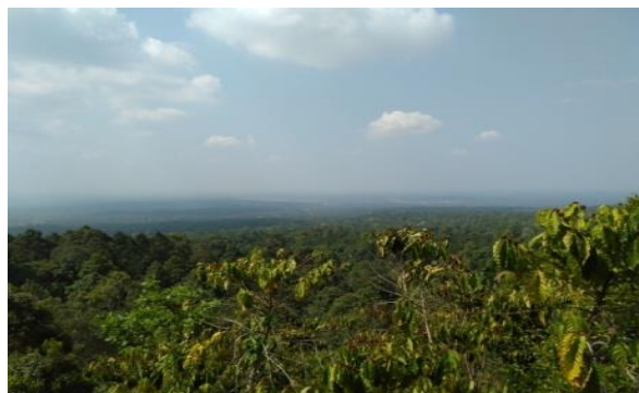
Gambar 5. Panorama alam Figure 5. Natural panorama