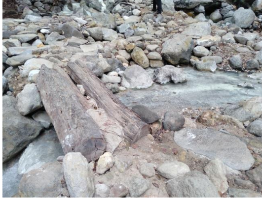
Gambar 7. Sumber mata air panas belerang yang tidak ada pagar Figure 7. Sulfur hot springs without fences

Selain itu, belum adanya tim penyelamat juga menjadi kekurangan karena ketika terjadi sesuatu yang darurat wisatawan tidak langsung mendapatkan pertolongan pertama. Tim penyelamat merupakan pelayanan yang diperlukan untuk menanggulangi kejadian yang tidak diinginkan saat melakukan perjalanan wisata (Masrin dan Akmalia, 2019).