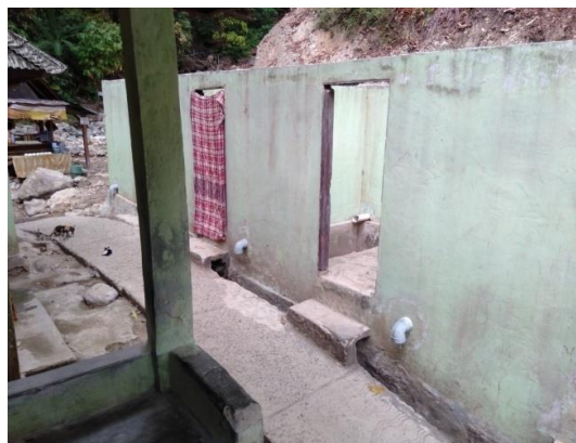
Gambar 8. Kondisi kamar bilas Figure 8. Condition rinse room

Kebersihan menjadi salah satu faktor yang mampu meningkatkan kunjungan wisatawan. Unsur kebersihan objek wisata Belerang Simpur termasuk dalam kategori cukup dengan nilai 3,41. Hal ini disebabkan karena kamar bilas yang disediakan terlihat kumuh, sehingga sebagian wisatawan menilai lokasi tersebut kebersihannya belum terjaga (Gambar 8). Menurut Darmawan dan Fadjarajani (2016), masalah kebersihan di suatu objek wisata harus segera diatasi agar tidak menimbulkan dampak negatif bagi wisatawan. Penelitian Saputri dan Dewi (2016) mengungkapkan bahwa keadaan bersih harus selalu direalisasikan pada lingkungan objek wisata supaya mencerminkan pengelolaan yang baik.