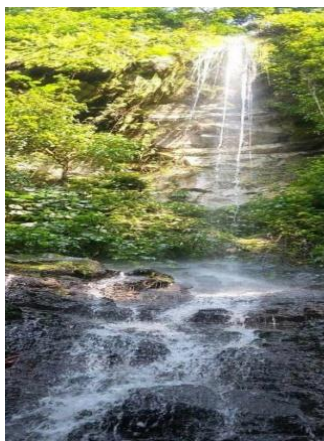
Gambar 2. Air terjun Cecakhah Kenali Figure 2. Cecakhah Kenali waterfall

pendukung dalam pengambilan gambar. Sementara itu, Yuni dan Artana (2016) mengungkapkan bahwa keberadaan air terjun dapat dinikmati oleh wisatawan hingga menimbulkan rasa nyaman dan tenang karena adanya pepohonan. Selain itu, air terjun yang berasal dari pegunungan Rajabasa dimanfaatkan wisatawan untuk berendam. Menurut Oktaviantari et al. (2019) kegiatan wisata air terjun dimanfaatkan sebagai kegiatan berendam dan menikmati guyuran air terjun.