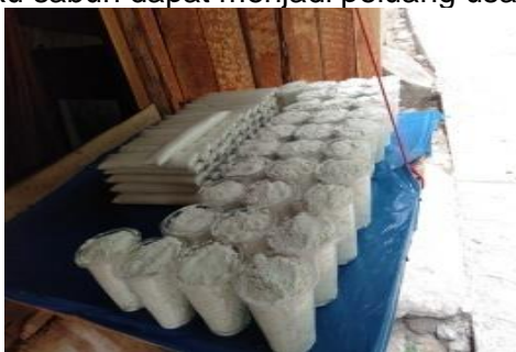
Gambar 4. Sabun belerang Figure 4. Sulfur soap

Pengelola objek wisata Belerang Simpur memanfaatkan endapan-endapan belerang sebagai sabun (Gambar 4). Pembuatan sabun belerang dilakukan dengan cara mengendapkan bilah bambu di air panas selama beberapa hari hingga terisi endapan belerang. Sabun dicetak menjadi dua versi yang berukuran 200 gram dan dijual dengan harga Rp 5.000,00, sedangkan sabun yang berukuran 600 gram dijual dengan harga Rp 10.000,00. Kegiatan tersebut dapat meningkatkan perekonomian masyarakat. Hal ini selaras dengan penelitian Sugiarto et al. (2016) yang menegaskan bahwa pengolahan potensi belerang sebagai bahan baku sabun dapat menjadi peluang usaha bagi masyarakat sekitar.