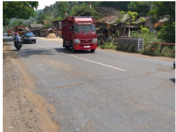
Gambar 1. Kondisi aspal jembatan way bako I (Sep 2018)

Setelah survey dilakukan dan didapatkan kondisi jembatan berdasarkan pengamatan visual, selanjutnya diberikan rekomendasi sebagai langkah tindak lanjut yang akan dilakukan.