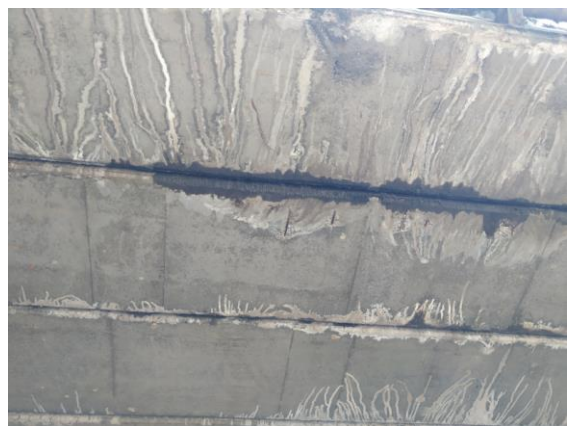
Gambar 2. Kondisi girder jembatan way bako I (Sep 2018)