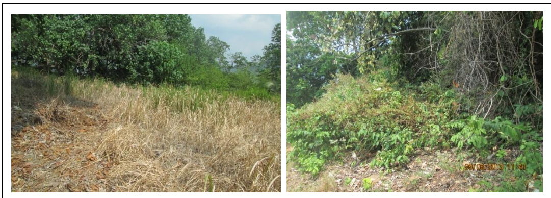
Gambar 3. Kondisi habitat di Pulau Puhawang Kecil gersang, tumbuhan pakan kering dan jumlahnya sedikit