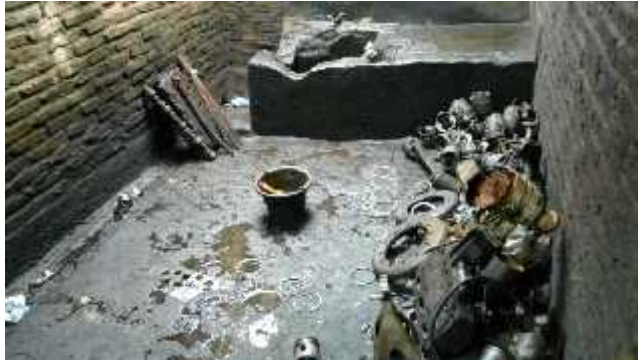
Gambar 4. Tempat Pembuangan Oli Bekas