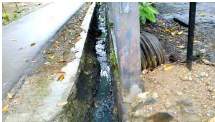
Gambar 6. Aliran Air (Parit) di area Bengkel "ABADI SERVICE" (Dok. Hasil Observasi, 2017)