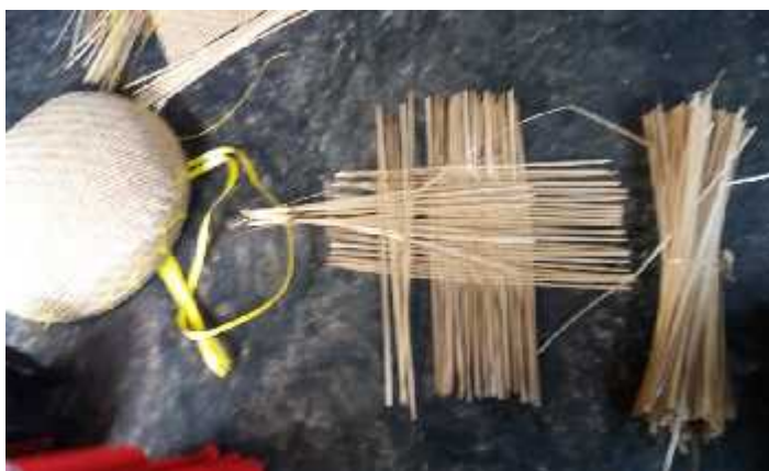
Gambar 4. Bahan Baku Pembuatan Kalo

Jenis bambu ini umumnya mempunyai rumpun yang rapat. Buluhnya mencapai tinggi 10-20 m, berwarna hijau terang sampai kekuning-kuningan. Percabangan tidak besar. Panjang ruas bambu tali 45 cm – 65 cm dengan diameter batang 5 cm – 8 cm. Batang bambu yang berumur 3 – 5 tahun memiliki tebal daging dan kulit 3 mm – 15 mm (Morisco, 2005). Cabang primer tumbuh dengan baik yang kemudian diikuti oleh cabang-cabang berikutnya. Pada buku-bukunya tampak adanya penonjolan dan berwarna agak kuning dengan miang coklat kehitam hitaman yang melekat. Pelelah buluhnya tidak mudah lepas dari buluhnya meskipun buluh sudah tua