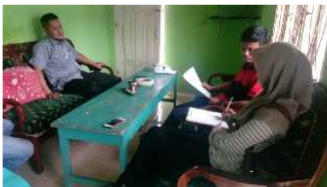
Gambar 5. Wawancara dengan pemilik ternak kambing

Dahulu konsumennya berasal dari berbagai daerah seperti Palembang, Jambi, Batam, Bengkulu namun sekarang hanya dari lingkungan sekitar. Menurutnya hal ini disebabkan pasar yang tidak jelas, daya beli masyarakat yang semakin rendah karena kebutuhan pokok semakin mahal. Dahulu penghasilan Rp 20.000.000 – Rp 25.000.000 bisa ia dapatkan dalam kurun waktu 1 bulan namun setelah penurunan daya beli masyarakat penghasilannya tidak lebih dari Rp 5.000.000 dalam sebulan. Ia mengaku dengan penurunan omset tersebut ia masih tetap bertahan dalam usahanya dan berusaha mencukupi kebutuhannya. Tidak ada peran pemerintah daerah dalam pengembangan usahanya, ia jalankan sendiri dengan kemampuan yang ia miliki. Lingkungan sekitar pun tidak ada yang pernah mengeluh untuk usaha yang pak Zainal jalankan karena memang lingkungan sekitar juga mendapatkan penghasilan dari ternak.