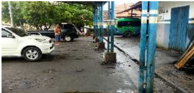
Gambar 3. Kondisi Tanah di Bengkel “ABADI SERVICE” (Dok. Hasil Observasi, 2017)

merusak kemurnian air tanah. Karena, di Bengkel “ABADI SERVICE” lantai yang digunakan terbuat dari tanah dan semen kasar. Berdasarkan hasil observasi oli-oli bekas yang tertumpah ditanah sudah merubah warna tanah menjadi lebih hitam dan berbau oli. Oli bekas di bengkel mobil “ABADI SERVICE” ditampung di sebuah kotak penampungan tanpa penutup. Hal ini tentunya oli bekas akan terpapar ke udara dan mencemari udara. Penggunaan wadah tersebut juga tidak sesuai dengan keputusan Kepala Bapedal no. 1 tahun 1995 yang menganjurkan kemasan/penampungan oli bekas yang digunakan harus tertutup untuk menghindari terjadinya paparan limbah B3 ke udara. Setelah penampungan oli bekas itu penuh, maka oli bekas akan dibuang ke kebun yang jauh dari pemukiman warga. Walaupun demikian akan berpengaruh terhadap mutu air bersih dan lingkungan di sekitar tempat pembuangan oli tersebut. Hal ini tentunya akan merusak ekosistem di lingkungan tempat pembuangan oli bekas tersebut.