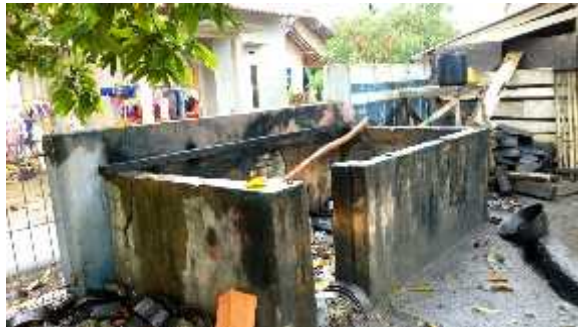
Gambar 5. Tempat Pembungan Sampah Bengkel "ABADI SERVICE" (Dok. Hasil Observasi 2017)

dipergunakan secara aman dan efisien (Suma'mur, 1985:1). Dengan demikian kepentingan keselamatan kerja harus lebih diperhatikan lagi, jika tidak diperhatikan akan mengakibatkan situasi yang fatal.