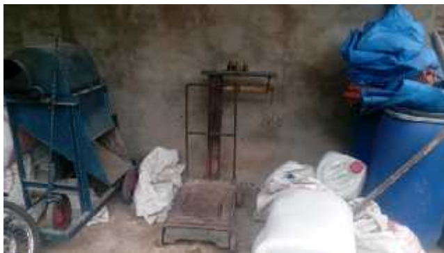
Gambar 3. Makanan kambing dan domba

pernah ada yang mengeluh tentang usahanya ataupun dengan bau kotoran kambing karena sebagian besar masyarakat juga memiliki ternak kambing walaupun dalam skala kecil.