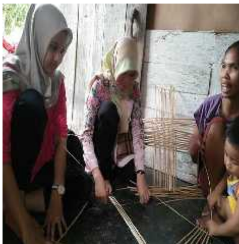
Gambar 1. Menganyam Bambu

Mayoritas penduduk di Pekon Tulung Agung Kecamatan Gading Rejo Kabupaten Pringsewu menjalani usaha sampingan sebagai penganyam tampah, irik, bakul, caping, dan kalo dan sebagian besar dari mereka berasal dari golongan ekonomi lemah walaupun ada juga masyarakat ekonomi menengah yang menjalani usaha sampingan sebagai penganyam barang-barang peralatan dapur. Menganyam bambu menjadi peralatan rumah tangga sudah sejak lama dilakukan oleh masyarakat di Pekon Tulung Agung Kecamatan Gading Rejo Kabupaten Pringsewu yaitu sejak jaman nenek moyang mereka dan terus berlangsung sampai sekarang dan diwariskan dari generasi ke generasi keturunannya sehingga tidak heran jika anak seusia sekolah dasar sudah pandai membuat peralatan dapur yang terbuat dari anyaman bambu.