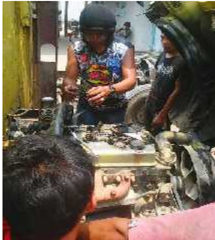
Gambar 2. Saat Karyawan Bengkel “ABADI SERVICE” Melakukan Servis Mobil Truk