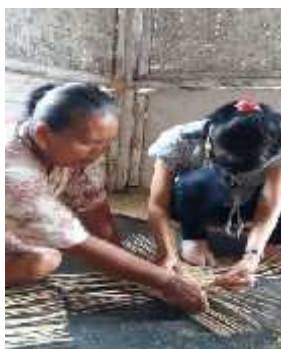
Gambar 1. Belajar menganyam

Akan tetapi waktu demi waktu anyaman semakin meningkat permintaanya di pasaran. Kegiatan ini akan lebih lancar apabila jalan lalu lintas yang menghubungkan konsumen dengan produksi mudah. Kegiatan yang terus berlangsung ini, lama kelamaan menjadi kegiatan yang turun-temurun.