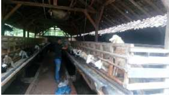
Gambar 1. Ternak Kambing dan Domba di Desa Purworejo