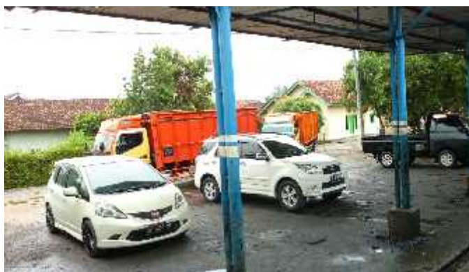
Gambar 1. Bengkel “ABADI SERVICE” Tambahrejo

Sejak berdirinya bengkel ini sudah banyak membuktikan perkembangannya yang pesat hingga saat ini, karena bengkel ini merupakan salah satu bengkel terlaris di Kabupaten Pringsewu sejak awal tahun berdirinya. Bengkel “ABADI SERVICE” menerima pelayanan perbaikan mobil seperti bongkar mesin, las bubut dan lain sebagainya yang berhubungan dengan perbaikan mobil. Sebagai salah satu bengkel independen bertaraf bengkel resmi, keberhasilan Bengkel “ABADI SERVICE” dalam memuaskan kebutuhan pelanggan didasari pada komitmen untuk terus belajar dan berkembang, diimbangi dengan penggunaan peralatan terbaru sesuai dengan perkembangan teknologi di industri otomotif.