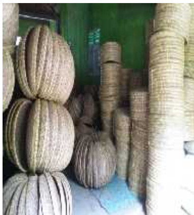
Gambar 3. Hasil Anyaman

yang tinggi. Hal ini disebabkan karena mereka tidak memiliki kemampuan untuk membuat barang-barang tersebut dan ditambah pula belum ada pihak eksternal seperti pemerintah daerah yang memberi mereka pelatihan-pelatihan untuk meningkatkan ketrampilan para pengrajin.