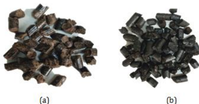
Gambar 2. Warna Pelet TKKS: (a) Sebelum Torefaksi/Kontrol, (b) Torefaksi pada Suhu 280°C Durasi 20 Menit dengan EF

Keterangan: Nilai merupakan rata-rata dari tiga pengukuran. Angka dalam kurung merupakan standar deviasi