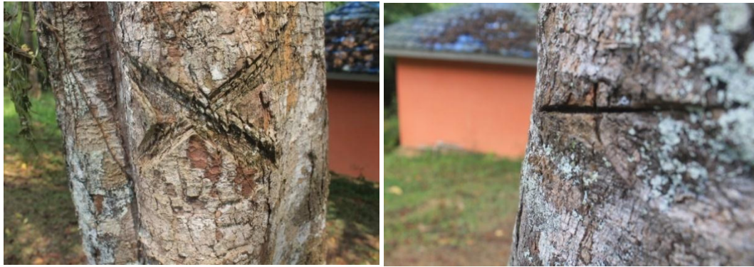
Gambar 2. Kerusakan luka terbuka pada pohon.

Tingkat kerusakan merupakan besaran tingkat keparahan pada bagian luas kerusakan yang terjadi pada pohon. Menurut Mangold (1997) tingkat keparahan merupakan persentase kerusakan dari setiap tipe kerusakan dan telah diklasifikasikan menjadi 9 tingkat mulai dari 10% hingga 90%.