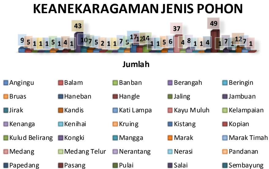
Gambar 1. Grafik keanekaragaman jenis tumbuhan

Lokasi wisata Bumi Perkemahan Kubu Perahu berada di Resort Balik Bukit TNBBS. Luas wilayah Bumi Perkemahan Kubu Perahu sebesar 1,48 ha dan terdapat 38 spesies pohon yang mengelilingi lokasi Bumi Perkemahan. Sedangkan jumlah pohon sebanyak 298 individu dari 38 spesies tersebut. Jenis-jenis pohon yang ditemukan pada lokasi wisata Bumi Perkemahan Kubu Perahu dapat dilihat pada Gambar 1.