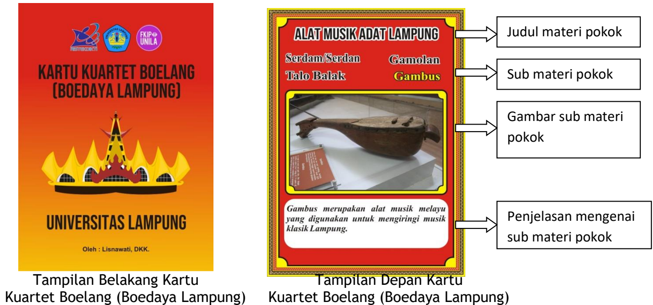
Gambar 1. Kartu Kuartet Boelang (Boedaya Lampung)

yang dibutuhkan dalam media pembelajaran. Identifikasi dan gambar desain media kartu kuartet Boelang seperti berikut ini :