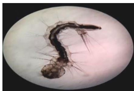
Gambar 1. Larva Ae. aegypti yang memiliki struktur tubuh utuh

Berikut adalah gambar-gambar pengamatan dan perubahan morfologi pada larva nyamuk Aedes aegypti :