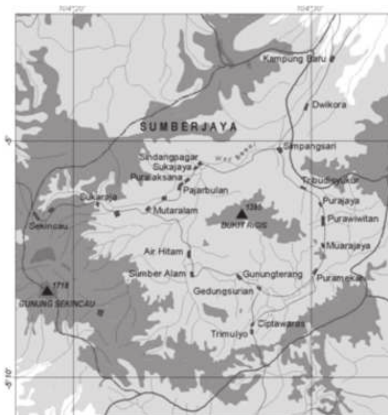
Gambar 1. Peta Sumberjaya dan Sub DAS Way Besai

Saat ini pekebun kopi di Lampung Barat terdiri dari berbagai etnis sebagai hasil transmigrasi spontan dan program transmigrasi Biro Rekonstruksi Nasional (BRN) pada tahun 1951