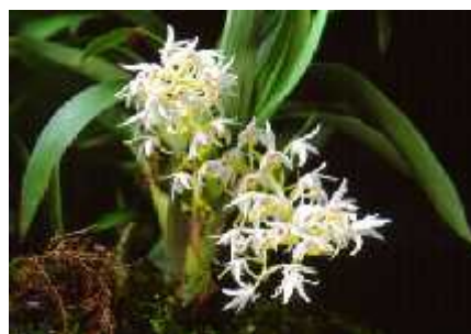
Gambar 7. Eria javanica (gambar diambil oleh Wardhana, Agustus 2012)

Anggrek E. javanica memiliki batang yang langsing di bagian pangkal dan membesar di bagian ujung dengan panjang mencapai 20 cm. Daun berbentuk seperti pedang, terdapat di ujung batang berbentuk melengkung dan agak sempit dengan panjang sekitar 15 cm. Tandan bunga keluar dari ketiak daun atau ujung batang dengan panjang 10 cm dan setiap tandan mempunyai 20—30 kuntum bunga. Bunganya kecil dengan warna yang beraneka ragam, dari putih, kuning susu, sampai lembayung. Kelopak dan mahkota bunga berbentuk mata tombak berwarna putih atau kuning pucat. Bibir bunga berbentuk pita, bertajuk tiga dengan bagian samping tumpul, tegak, dan bagian tengahnya panjang beralur kuning.