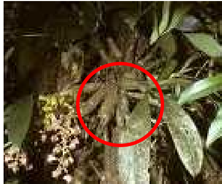
Gambar 2. Kondisi umbi Eria flavescens yang tidak sehat