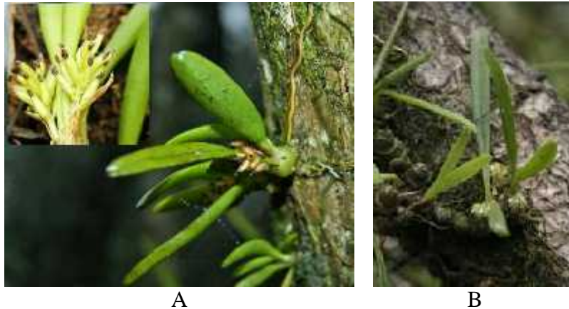
Gambar 11. A. Eria retusa (gambar diambil oleh Wardhana, Agustus 2012) B. Eria retusa (gambar diambil oleh Albarkati, Agustus 2015)

Anggrek E. retusa merupakan anggrek epifit yang tumbuh simpodial. Umbi semunya berbentuk bulat hingga oval, berdiameter 1-1,5 cm. Rata-rata memiliki satu hingga dua daun pada setiap ujung umbinya. Daun dari anggrek ini tebal berdaging, berbentuk lanset memanjang, berukuran panjang 5 cm hingga 11 cm, dan lebarnya 0,5-1 cm. Perbungaan anggrek E. retusa tersusun dalam bentuk tandan, tumbuh di ujung umbi. Tangkai perbungaannya memiliki panjang 1,8 cm, jumlah bunganya sekitar 12-16 kuntum. Bunga anggrek ini berwarna kuning pucat, kelopaknya berbentuk triangular, mahkota berbentuk lanset dengan ukuran panjang yang hampir sama dengan kelopaknya. Bibir bunganya berbentuk bulat telur dan seluruh permukaan bunganya berbulu.