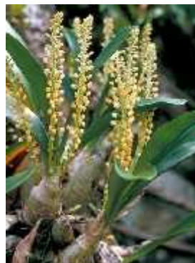
Gambar 5. Eria flavescens

Anggrek E. flavescens merupakan anggrek epifit yang tumbuh simpodial. Anggrek tersebut memiliki umbi semu berukuran panjang 20 cm dan tebal hingga 2 cm. Daunnya berjumlah 2—4 helai, muncul dari ujung umbi semu, berukuran lebar 30 cm dan panjang 50 cm tetapi anggrek E. flavescens yang hidup di dataran rendah berukuran lebih kecil. Perbungaannya muncul di ujung umbi semu yang berdaun, panjangnya 10—15 cm, mendukung 10—20 kuntum bunga, tersusun dalam bentuk tandan. Hampir seluruh permukaan bunganya ditumbuhi bulu halus berwarna coklat. Pada saat bunga anggrek ini mekar penuh berukuran lebar 1,25 cm, beraroma asam menyengat, seluruh perhiasan bunganya berwarna dasar kuning pucat kehijauan dan bergaris-garis merah hati. Setiap bunga memiliki daun pelindung yang berwarna hijau muda, terletak di pangkal gagang bunga. Kelopak punggung anggrek ini berbentuk bulat telur, berukuran panjang 12 mm dan lebar 5 mm, kelopak sampingnya membentuk dagu ( mentum ), lebar di bagian dasar, berukuran panjang 13,5 mm dan lebar 6 mm. Mahkotanya berukuran lebih sempit berukuran panjang 10 mm dan lebar 4 mm. Bibir bunga anggrek E. flavescens didominasi warna merah hati, dan ujungnya menekuk ke bawah. Anggrek E. flavescens merupakan jenis anggrek dataran tinggi.