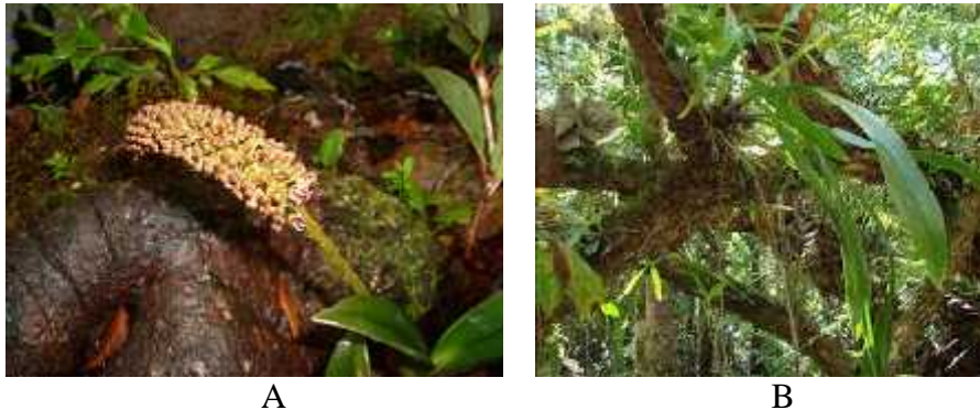
Gambar 12. A. Eria robusta (gambar diambil dari www.flickrhivemind.net , Februari 2015) B. Eria robusta (gambar diambil oleh Albarkati, Agustus 2015)

kecil, berbentuk seperti pita yang memanjang dan terbuka ke samping. Bibir bunganya berwarna kuning, ujungnya seperti segitiga meruncing dan menekuk ke bawah.