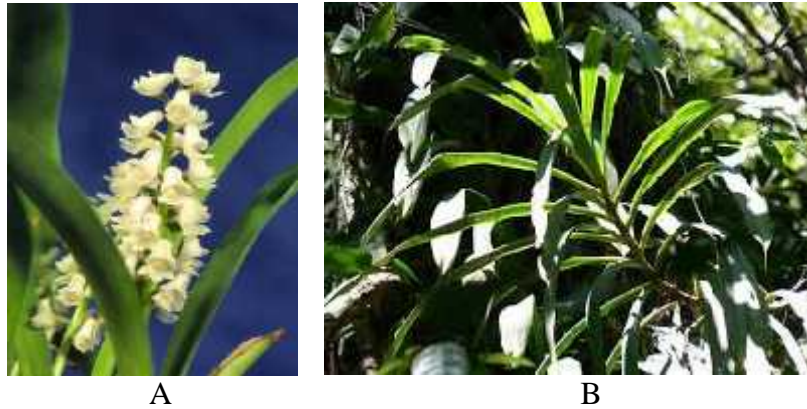
Gambar 4. A. Eria erecta (November 2008) B. Eria erecta (Agustus 2015)