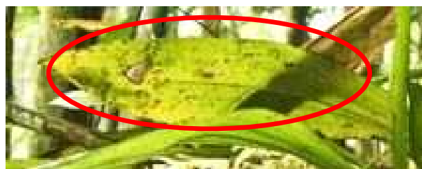
Gambar 1. Kondisi daun anggrek Eria javanica yang tidak sehat

Pada umumnya 80—90 % anggrek Eria spp. yang ditemukan di lokasi penelitian dalam kondisi sehat. Akan tetapi, ada sebagian kecil yaitu 10—20 % ditemukan dalam kondisi daun layu, batang daun mengering/busuk dan bunga yang gugur. Kondisi ini ditunjukkan pada Gambar 1 dan Gambar 2.