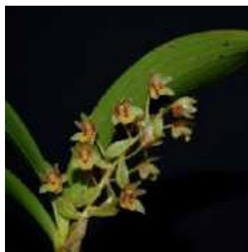
Gambar 3. Eria discolor

Anggrek E. discolor merupakan anggrek epifit yang tumbuh menjalar. Akar rimpang anggrek tersebut bersifat keras dan kaku, membentuk umbi semu dengan jarak antar dua umbi 20—50 cm. Umbi semuanya menggembung di bagian tengah dan meruncing di kedua ujungnya, panjang 15 cm, setiap umbi memiliki 4—6 helai daun. Daun berbentuk lanset, berukuran panjang 10 cm dan lebar 2,5 cm, dan ujungnya terbelah dua. Perbungaan anggrek ini tumbuh di ketiak daun, memanjang secara bertahap hingga 8 cm, bunganya mekar tidak serempak dan hanya 1—2 kuntum yang mekar bersamaan, serta memiliki daun penumpu. Pada saat bunga mekar ukurannya berdiameter 1,7 cm. Perhiasan bunganya berwarna kuning dan di bagian luarnya ditumbuhi bulu-bulu halus berwarna putih. Bibir bunga pada anggrek ini tidak bulat penuh tapi berbentuk segi lima, tidak bercuping, berwarna coklat tua dengan tonjolan kuning di tengahnya.