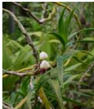
Gambar 9. Eria mucronata

Anggrek E. mucronata merupakan anggrek epifit. Batangnya menggantung, panjangnya mencapai 1 m, berdaging, menggalah, dan ujung batangnya pipih. Daun dari anggrek ini berbentuk lanset, lancip, berdaging dan liat, panjang 5,5—12 cm, lebar di bagian tengahnya 6—10 mm. Perbungaannya tumbuh di lateral atau di samping daun, berukuran pendek, biasanya mendukung 2 bunga, daun pelindung bunga berwarna merah. Bunga anggrek ini berukuran relatif besar tetapi tidak membuka penuh pada saat mekar, berwarna putih kekuningan, daun kelopak bagian dorsal melonjong dan tumpul, panjang 1,9 cm. Pada bagian pangkal kelopak melebar membentuk mentum yang ujungnya tumpul, panjang 1,2 cm. Daun mahkota berbentuk bulat telur, romping ( truncate ) dan berembang ( apiculate ), panjang 1,9 cm. Bibir bunga anggrek E. mucronata berukuran pendek, dibagian pangkal berbentuk seperti ginjal, di bagian tengah bercuping 3, cuping samping tegak dan berbentuk setengah lingkaran, cuping tengah berukuran lebih kecil dan mempunyai anak cuping, pada helaian cuping tengah terdapat tunas yang memanjang dari pangkal ke bagian ujung, panjang bibir bunganya 1,1 cm dan lebar 1,5 cm.