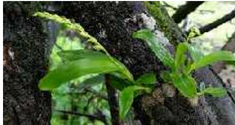
Gambar 8. Eria junghunii (gambar diambil dari Amazonaws.com, Agustus 2015)