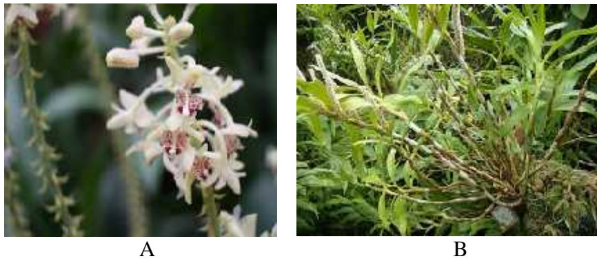
Gambar 10. A. Eria oblitterata B. Eria oblitterata