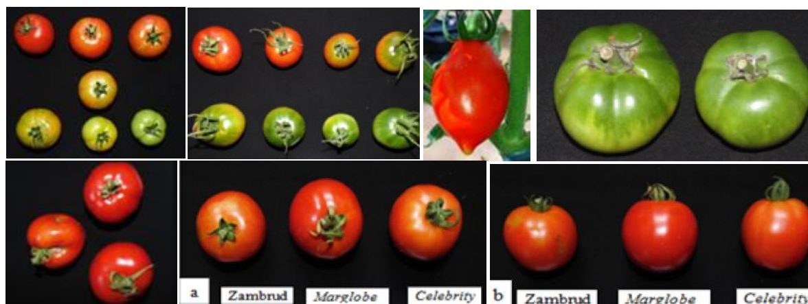
Gambar 3. Graduasi warna buah matang hingga muda varietas a) Zambrud, b) Marglobe , c) Martino's Roma (Matang), d) Celebrity (muda), e) Celebrity (muda), Perbandingan karakter buah varietas Zambrud, Marglobe dan Celebrity ) f) gambar buah tampak atas, g) gambar buah tampak samping