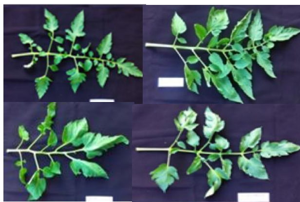
Gambar 1. Bentuk daun varietas a) Zambrud(Peruvianum), b) Celebrity, c) Martino's Roma, d) Marglobe

Keterangan: Angka-angka dalam satu kolom yang diikuti huruf mutu yang sama tidak berbeda nyata pada uji BNT taraf 5%,