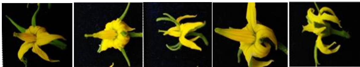
Gambar 2. Posisi stigma pada bunga tomat varietas a) Zambrud(sejajar, stigma sama tinggi dengan ujung tabung anther), b) Celebrity , c) Ponderosa RBS , d) Martino's Roma