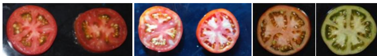
Gambar 4. Bentuk dan warna penampakan dalam buah a) Zambrud, b) Celebrity , c) Marglobe