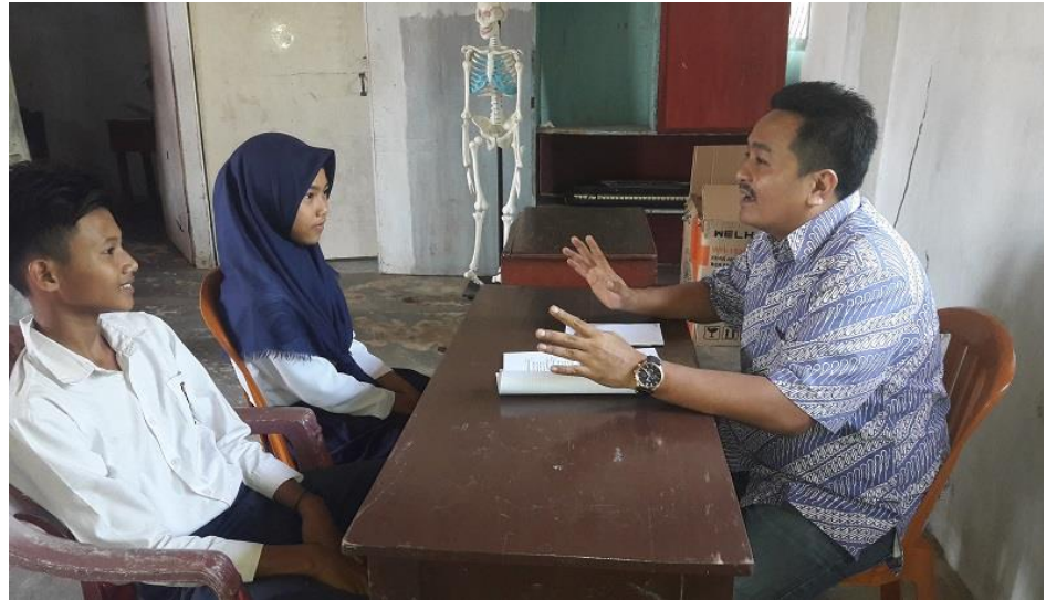
DOKUMENTASI VISITASI SMP KAUSAR KARANG PUC UNG LAMPUNG SELATAN