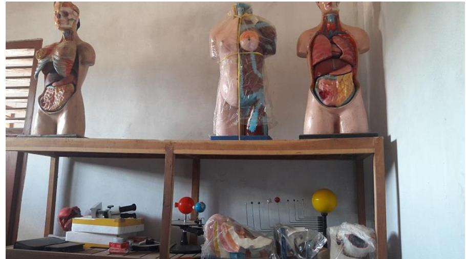
DOKUMENTASI VISITASI SMP KAUSAR KARANG PUC UNG LAMPUNG SELATAN