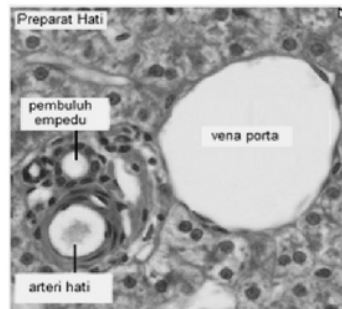
Gambar 2. Letak Vena Porta Yang Menjadi Sasaran Pengamatan Kejadian Kongesti Pada Hati

Untuk mendapat preparat hati yang akan dianalisis struktur histologisnya, mencit yang telah didekapitasi dan diambil darahnya dibedah untuk diambil organ hatinya. Sediaan (preparat) histologi organ hati dibuat dengan metode parafin, menggunakan pewarnaan HE (Haematoxylin-Eosin), formalin 10%, xylol