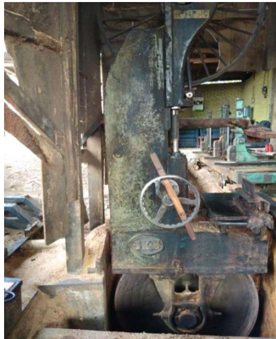
Gambar 2. Bandsaw tipe 36 pada sawmill rakyat.

Proses penggergajian pada sawmill rakyat di Desa Sukamarga menggunakan bandsaw , dengan jumlah 1-3 mesin per sawmill . Bandsaw yang digunakan adalah tipe 36 (Gambar 2), berbahan bakar solar dengan mesin penggerak 20-24 HP. Ukuran mata pisau gergaji (6350 x 100 x 0,95) mm. Rata-rata jumlah karyawan per mesin adalah 11 orang dengan rincian 6 orang operator, 4 orang tukang ikat ( packing ) dan 1 orang teknisi. Karyawan pada sawmill rakyat digaji sebesar Rp 140.000/m 3 dibagi 11 orang karyawan. Pembagian gaji karyawan berdasarkan beban pekerjaan dan dalam 1 hari kerja pada sawmill rakyat bisa menghasilkan 10-12 m 3 kayu gergajian.