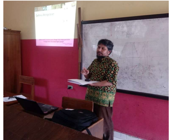
Gambar 3. Ceramah Umum pengelasan maju

Kegiatan penyuluhan ini disampaikan oleh tim pengabdian jurusan Teknik Mesin Universitas Lampung. Materi yang disampaikan adalah mengenai Pelatihan Pengelasan Gesek ( Friction Welding ) dengan Mesin Bubut, sebagaimana Gambar 3 s.d. Gambar 5 (Sukmana, dkk., 2017).