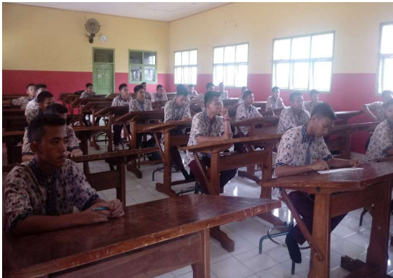
Gambar 5. Pelaksanaan test tulis PKM

Hasil dari penyuluhan tentang Pelatihan Pengelasan Gesek ( Friction Welding ) Dengan Mesin Bubut ini dapat dilihat dari hasil test sebelum dan setelah dilakukan penyuluhan, seperti tercantum pada Tabel 1 dan 2.