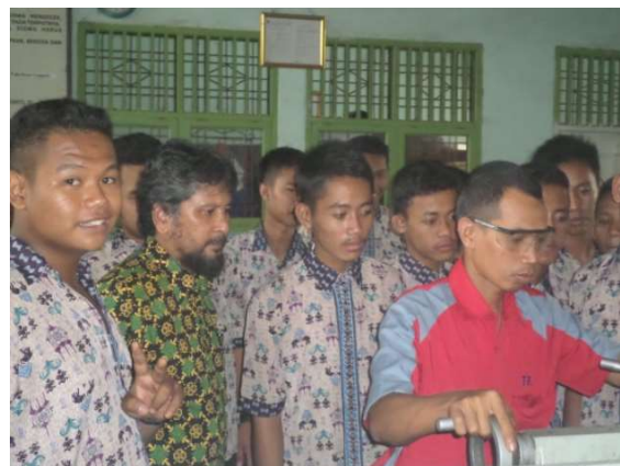
Gambar 4. Pelatihan dibantu guru kelas