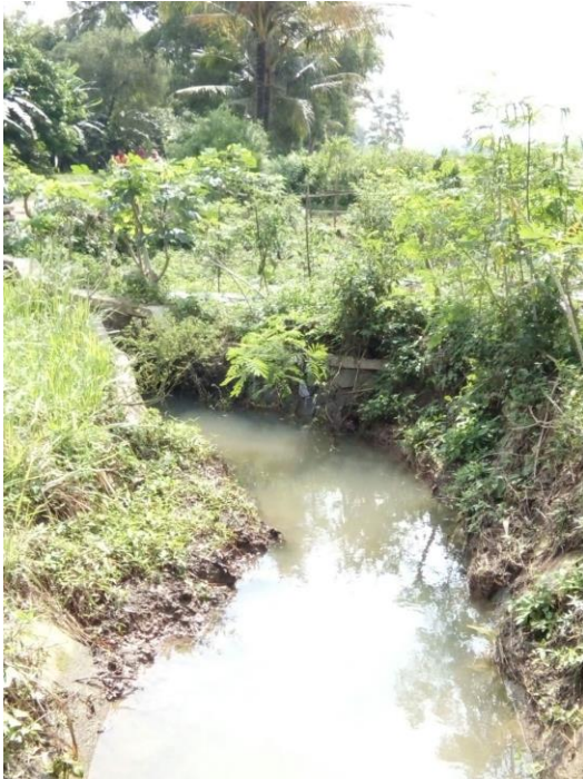
Gambar 3. Lining saluran tidak terawat