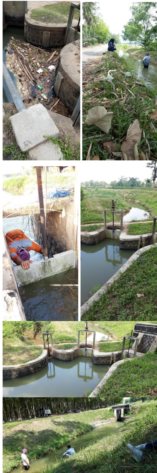
Gambar 6. Hasil kegiatan perbaikan, pemeliharaan dan perawatan jaringan irigasi

Gambar kegiatan maupun hasil kegiatan perbaikan, pemeliharaan dan perawatan jaringan irigasi disajikan pada Gambar 6.