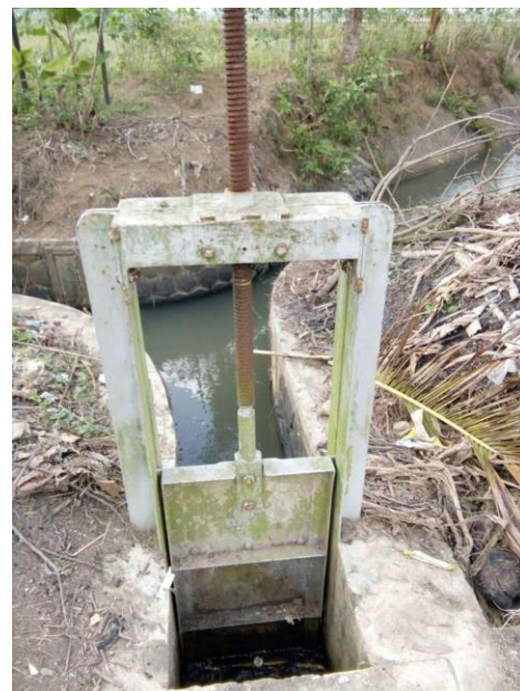
Gambar 2. Kondisi pintu air irigasi yang bocor

BPU 15 merupakan bagian dari Daerah Irigasi Punggur Utara. Beberapa kondisi saluran maupun pintu air disajikan pada Gambar 2, 3 dan 4. Gambar 2 menunjukkan salah satu pintu air yang dibobok bagian bawahnya. Gambar 3 menunjukkan kondisi lining saluran yang sudah ditumbuhi rerumputan. Hal ini menyebabkan kecepatan aliran di saluran berkurang, mengakibatkan pengendapan sedimen dan tertundanya air sampai ke saluran di hilirnya. Gambar 4 menunjukkan kondisi saluran yang kotor disebabkan pembuangan sampah oleh warga ke saluran irigasi dan mengakibatkan penumpukan sampah di pintu saluran.