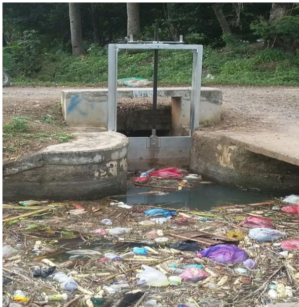
Gambar 4. Sampah di saluran irigasi