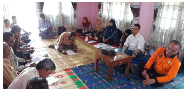
Gambar 5. Kegiatan peningkatan pengetahuan dan pemahaman

Kegiatan peningkatan pengetahuan dan pemahaman ini juga diukur melalui tes dan didapatkan hasil nilai rerata peserta tes sejumlah 21