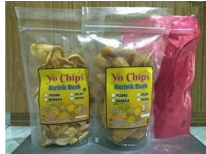
Gambar 7. "Yo Chips" keripik buah produksi mitra PKM 2018 dalam dua jenis kemasan

Usaha publikasi dan promosi keripik buah "YoChips" kepada masyarakat umum telah dilakukan dengan menulis artikel berjudul "Yo Chips keripik Buah Produk Mitra PKM Unila" yang dimuat dalam koran Lampung Post edisi 02 Oktober 2018. Selain itu, keripik buah "Yo Chips" juga ikut serta di dalam pameran Lampung Fair pada tanggal 12—27 Oktober 2018 (Gambar 8).