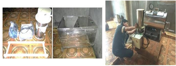
Gambar 2. Perakitan dan perbaikan vacuum frying

Prinsip kerja vacuum frying adalah menghisap air di dalam buah dengan kecepatan tinggi sehingga air terserap sempurna. Hal ini dilakukan dengan mengatur keseimbangan suhu dan tekanan vakum. Suhu penggorengan dapat terkontrol otomatis pada 85—95 0 C dan tekanan vakum 700 mmHg untuk menghasilkan produk dengan kualitas yang bagus dalam warna, rasa dan aroma (Deptan, 2000).