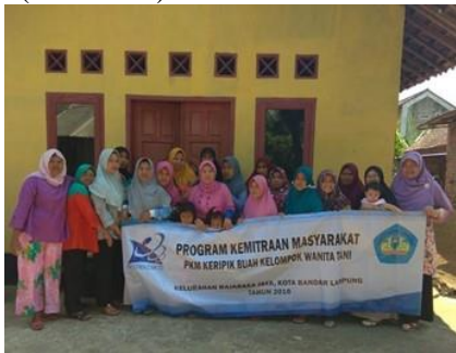
Gambar 1. Mitra PKM keripik buah tahun 2018

Rangkaian kegiatan PKM diawali dengan rapat koordinasi Tim Pelaksana pada tanggal 21 Maret 2018. Hasil rapat berupa tema-tema dan jadwal pelaksanaan kegiatan penyuluhan, pelatihan, dan praktik yang disosialisasikan kepada mitra PKM pada tanggal 14 April 2018 dan dihadiri oleh para anggota dan pengurus KWT mitra serta PPL setempat. Kegiatan ini juga bertujuan menampung ide dan saran dari mitra agar rencana kegiatan dapat berjalan dengan baik. Diskusi berlangsung dengan lancar, mitra berkomitmen untuk berperan aktif dalam kegiatan PKM ini (Gambar 1).