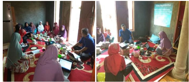
Gambar 4 Pelatihan manajemen & analisis usaha kelompok

Kegiatan penyuluhan terkait higienitas dilaksanakan pada tanggal 19 Agustus 2018. Pengetahuan tentang higienitas sangat penting bagi produsen produk pangan dan merupakan salah satu unsur persyaratan untuk mendapatkan izin PIRT. Materi yang disampaikan kepada mitra terkait prinsip-prinsip higienitas dari mulai pemilihan bahan baku, proses persiapan bahan, proses pengolahan, pengemasan dan penyimpanan. Penerapan prinsip-prinsip higienitas selain menjamin keamanan pangan juga mampu mengoptimalkan pemanfaatan bahan baku dan mencegah kerugian akibat kesalahan selama proses penyimpanannya.