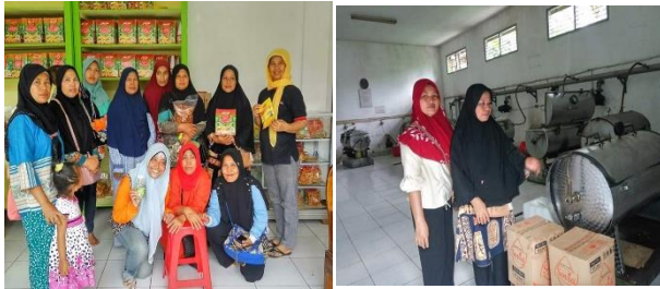
Gambar 6. Kunjungan mitra ke produsen keripik buah

Pengadaan peralatan pendukung produksi keripik buah berupa, refrigerator, lemari etalase produk, meja stainless, hand sealler , timbangan digital & timbangan pegas, baskom stainless, nampan stainless, pisau stainless, sendok besar stainless, stoples besar, dan talenan. Pengadaan dua jenis bahan kemasan yaitu pouch berbahan full plastik dan bahan kombinasi aluminium foil & plastik, serta label kemasan produk (Gambar 7).