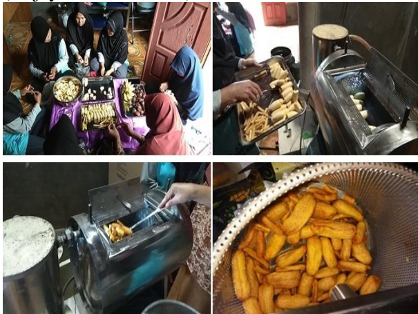
Gambar 3. Pelatihan pembuatan keripik buah dengan mesin vacuum frying

banyak mengubah bentuk dan cita rasanya (Wijayanti, dkk., 2011).