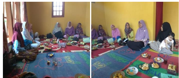
Gambar 5. Penyuluhan higienitas proses produksi dan prosedur PIRT

Prosedur perizinan PIRT dari Dinas Kesehatan dilakukan melalui Puskesmas setempat. Pihak Dinas Kesehatan meninjau lokasi produksi dan menilai produk untuk menetapkan layak atau tidak produsen mendapatkan izin PIRT. Oleh karena itu prinsip-prinsip higien perlu diterapkan seperti menggunakan sarung tangan, penutup kepala, dan celemek saat produksi. Peralatan yang digunakan diupayakan terbuat dari bahan stainless agar terhindar dari karat dan kontaminasi polimer-polimer plastik. Ruang produksi juga perlu diberi plafon agar memenuhi syarat perizinan PIRT (Gambar 5).