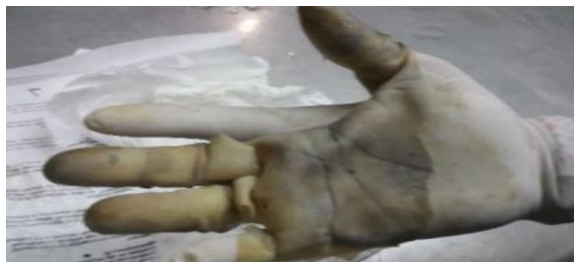
Gambar 7: Kulit Yang Telah Dilepas Dipasang Ke Tangan Petugas.