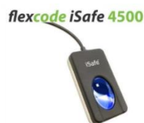
Gambar 1. Alat Perekam Sidik Jari

Pemerintah Indonesia telah menerapkan metode template matching ini dengan melakukan perekaman sidik jari saat membuat Kartu Tanda Penduduk Elektronik (E-KTP). Setiap orang mempunyai template sidik jari yang berbeda-beda, maka dari itu sidik jari dibuat menjadi patokan dari metode ini. Alat yang digunakan sebagai perantara sidik jarinya adalah flexcode iSafe 4500.