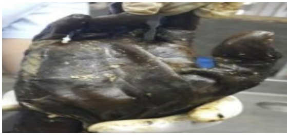
Gambar 4: Kondisi Kulit Tangan Yang Busuk Dan Terlepas