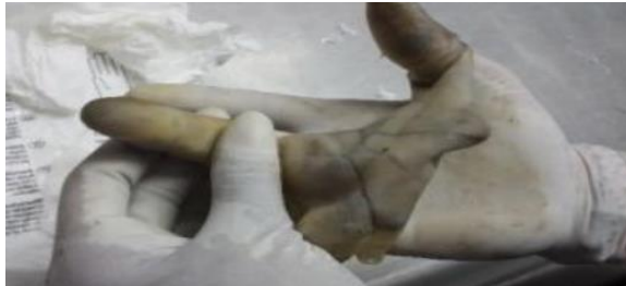
Gambar 5: Kulit Dipasang Kembali Pada Jari Mayat Atau Dimasukkan Dalam Jari Terugas Sehingga Pengambilan Dapat Dilakukan.