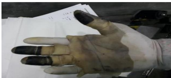
Gambar 8: Kulit Yang Telah Dilepas Diberi Tinta Dan Ambil Sidik Jari Seperti Cara Rutin