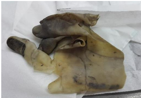
Gambar 6: Kulit Yang Telah Dilepas Dari Tangan Jenazah